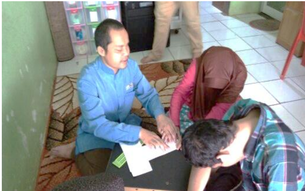
Kegiatan belajar membaca dan menulis huruf hijaiyah braille pada 28 November 2018.