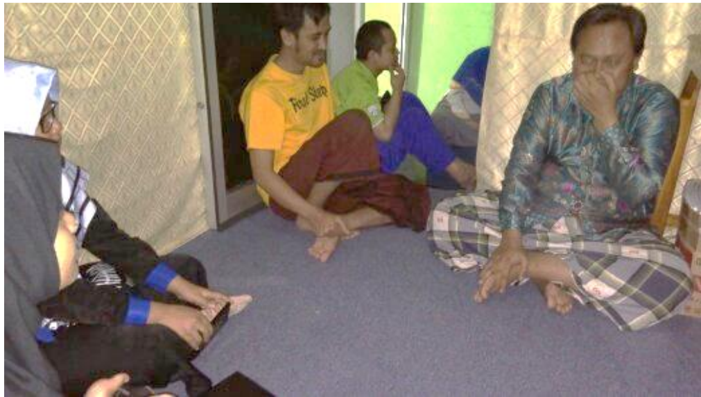
Kegiatan kajian pemahaman terhadap ayat-ayat Al-Qur'an pada 21 November 2018.