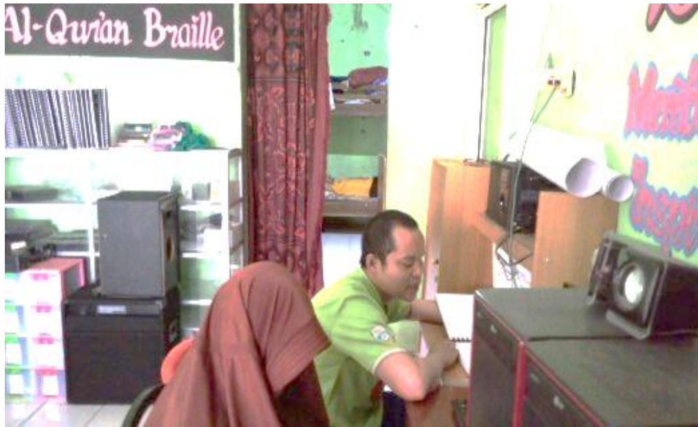
Kegiatan tahfidz Al-Qur'an pada 21 November 2018.