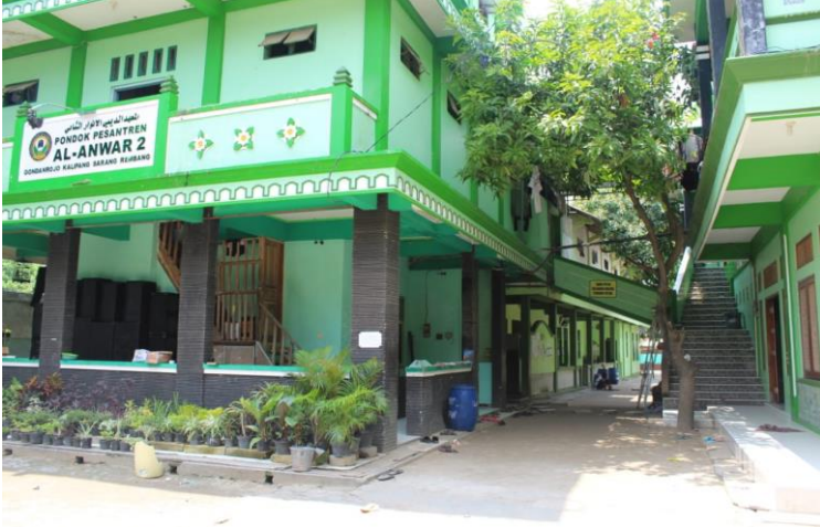
المعهد الديني الانوار الثاني سارانج رمانج