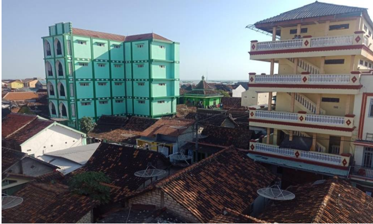
المعهد الديني الانوار سارانج رمانج