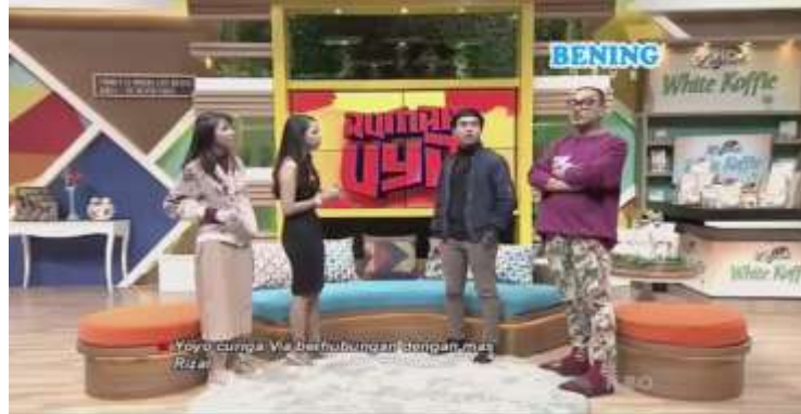
Namimah dengan isyarat