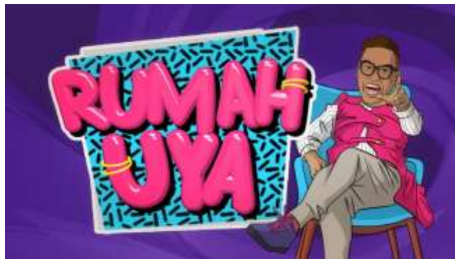
Logo “Rumah Uya”