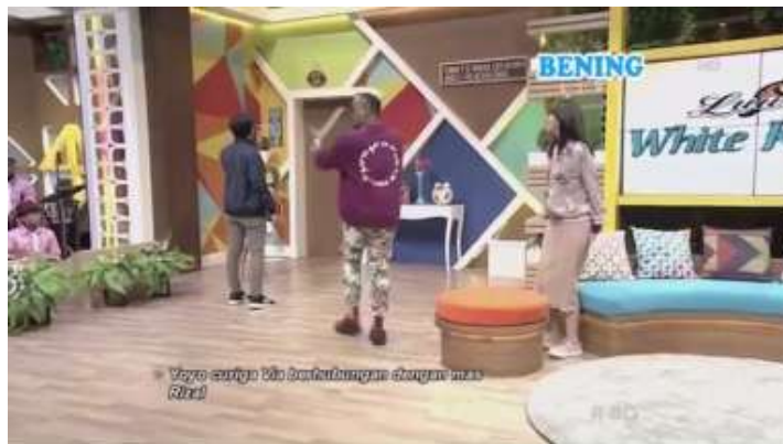
Namimah dengan lugas

Pada scene ini (12:49) terdapat perbuatan namimah dengan lugas yang dilakukan oleh Uya Kuya dengan mengatakan “nahh mas Rizal, kamu bilang mas Rizal ngapain, berarti kamu kenal dengan mas Rizal ini dong?”. Walaupun maksud Uya Kuya untuk mengklarifikasi atas pengakuan Via sebelumnya yang mengaku tidak mengenal mas Rizal, namun hal ini secara tidak langsung memancing amarah dari Yoyo kepada Via karena merasa dibohongi.