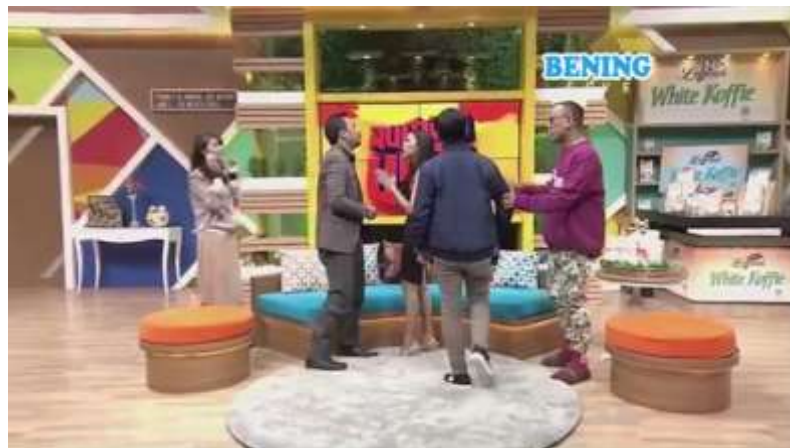
Namimah dengan lugas

Pada scene ini (32:05) terdapat perbuatan namimah secara lugas yang dilakukan oleh Uya Kuya ketika Via meminta Yoyo untuk tidak pergi karena merasa kesal mas Rizal melamar Via di depannya dan untuk mendengarkan penjelasannya, namun di sini Uya Kuya justru mengompromi Yoyo dengan mengatakan “kamu disuruh dia lihatin terima lamarannya kali”, jelas hal ini membuat Via kesal dengan Uya Kuya karena bisa saja Yoyo semakin kesal dan pergi.