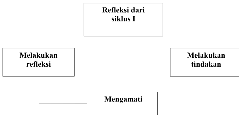
Gambar 3.3 Diagram alur pemikiran dalam penyusunan penelitian tindakan kelas pada siklus II.

Karena perbaikan pembelajaran pada mata pelajaran IPA berlangsung dalam dua siklus, maka kegiatan merancang dan melaksanakan perbaikan pembelajaran dapat di gambarkan dalam bentuk diagram berikut: