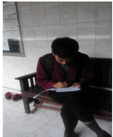
Gambar 4 Pengisian Instrumen Mahasiswa PB 8A