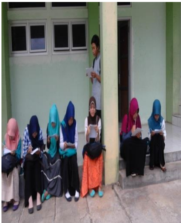
Gambar 3 Pengisian Instrumen Mahasiswa PB 6A