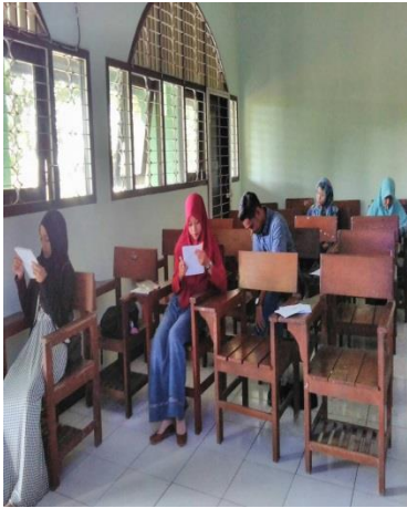
Gambar 1 Pengisian Instrumen Mahasiswa PB 4A