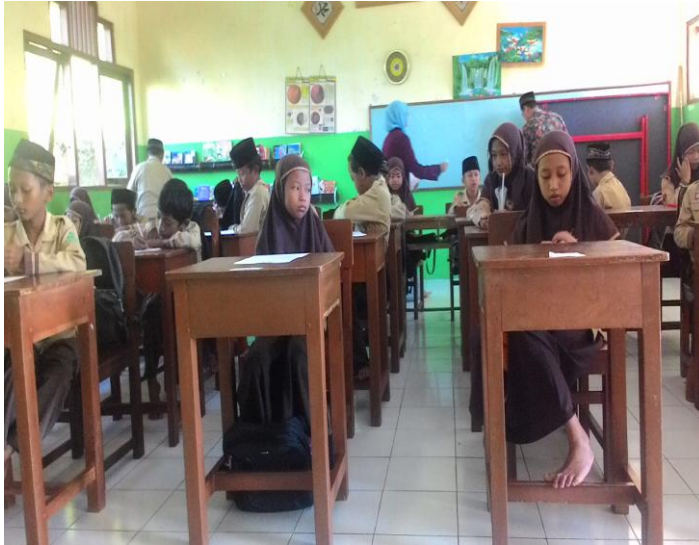
Tahap persiapan test