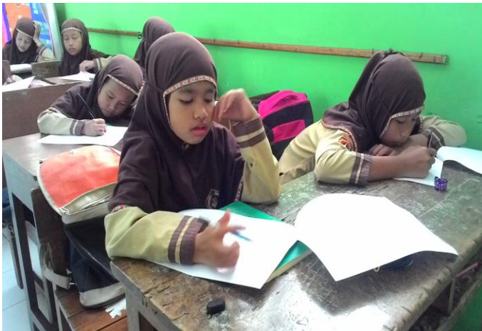
Kegiatan test membaca Al-Qur'an peserta didik