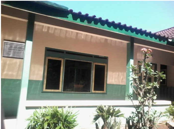
Ruangan kelas MI Miftahul Ulum 1