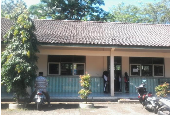
Ruang kelas MI Miftahul Ulum 1