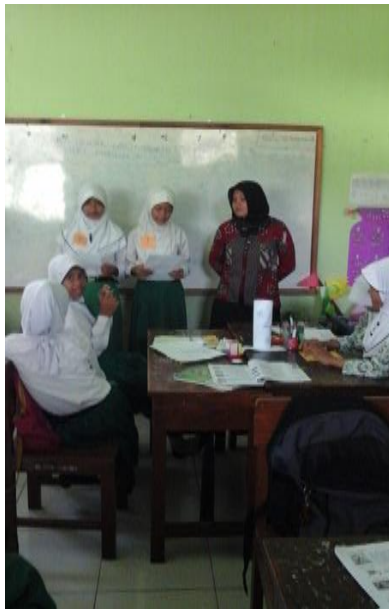
Perwakilan kelompok maju untuk mempresentasikan hasil diskusinya