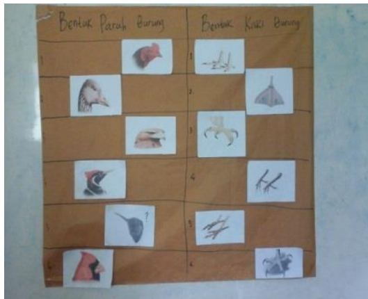
Hasil dari metode picture and picture