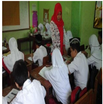
Peneliti memberikan arahan/ penjelasan