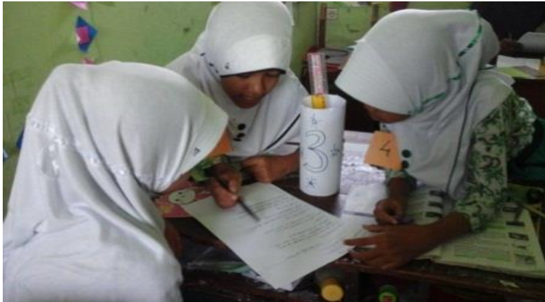
Berdiskusi tentang cara hewan melindungi dari musuhnya