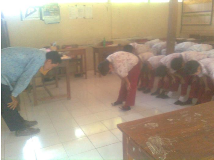
Guru memperagakan gerakan shalat