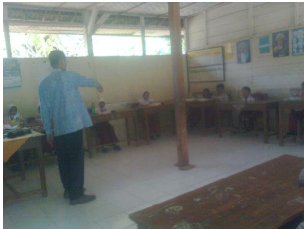
Guru menyeting kelas dengan bentuk huruf U