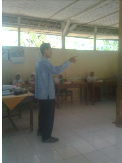
Guru menjelaskan materi tentang shalat berjamaah