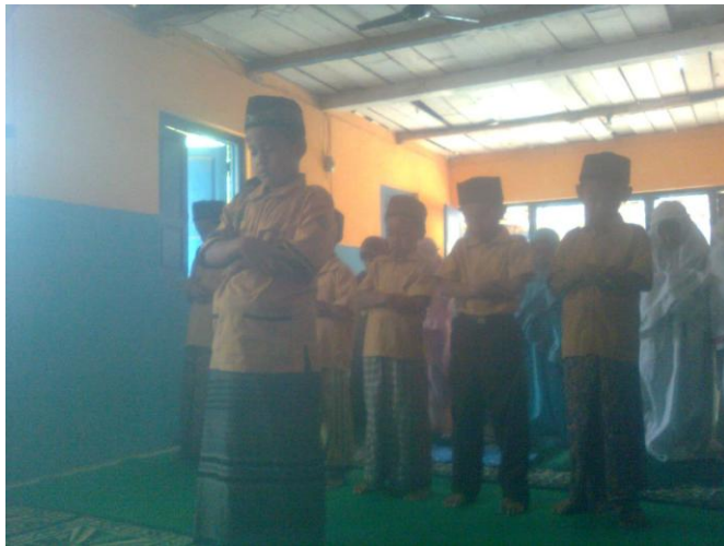
Siswa praktik shalat berjamaah secara berkelompok