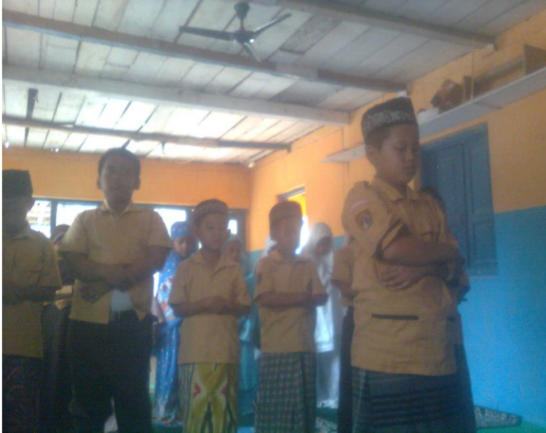
Siswa praktik shalat berjamaah secara berkelompok