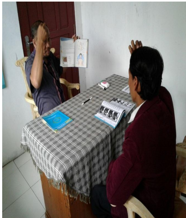
Praktek metode SEFT Total Solution dengan konselor