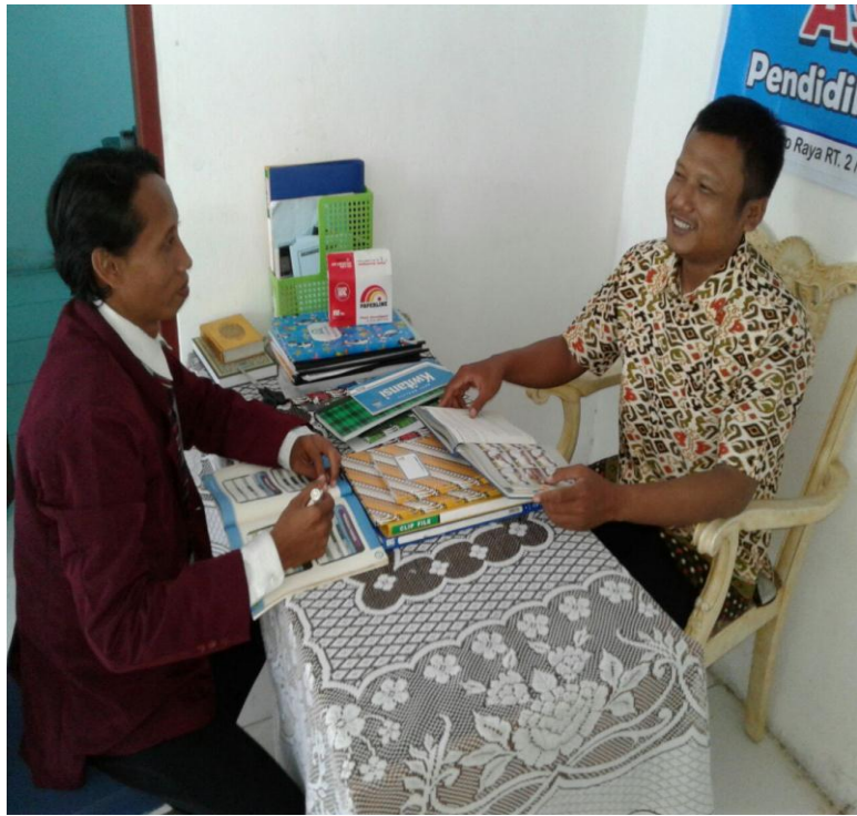
Wawancara bersama staf Yayasan As Samawat