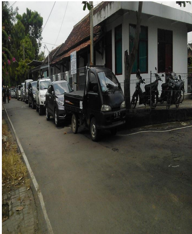
Foto Yayasan As Samawat dari arah depan Foto Yayasan As Samawat dari arah samping