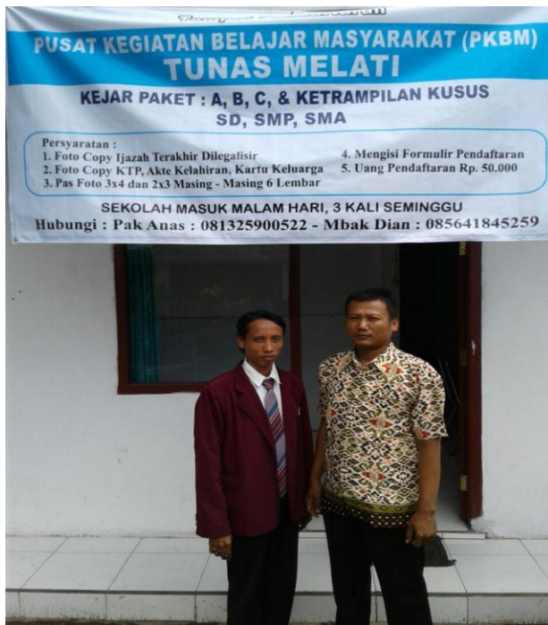
Foto dengan staf Yayasan di depan kantor PKBM Tunas Melati