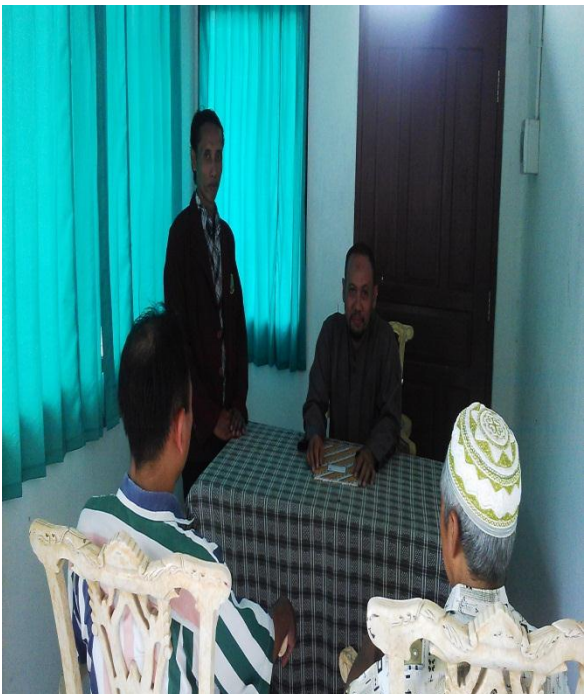
Kegiatan Bimbingan dan Konseling dengan orang tua korban