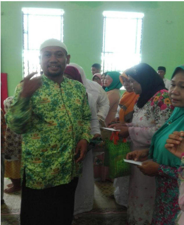
Kegiatan santunan anak yatim piatu dan fakir miskin