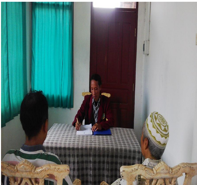
Wawancara dengan orang tua klien (korban) di Yayasan As Samawat