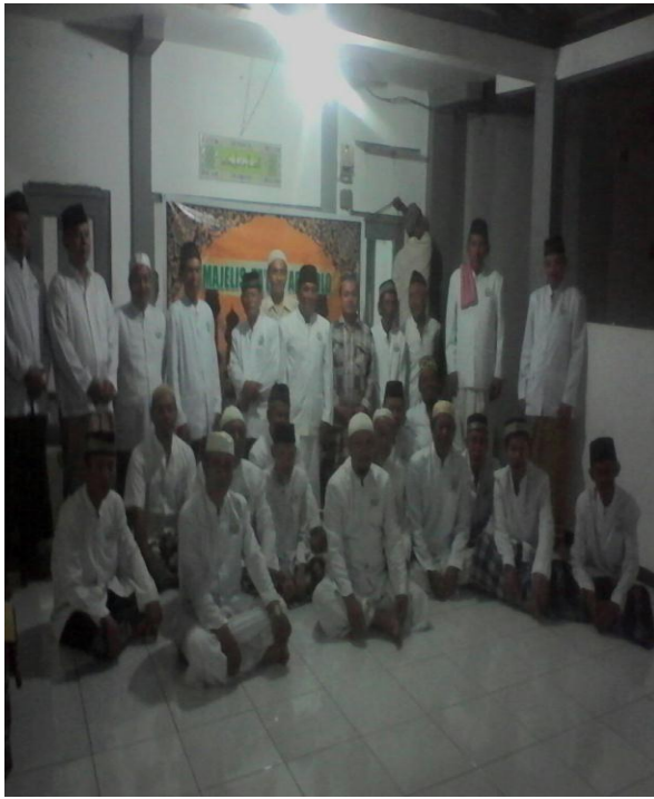
Foto Kegiatan Keagamaan Yayasan As Samawat