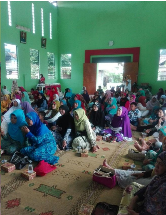
Kegiatan pelatihan SEFT Total Solution kepada ibu-ibu