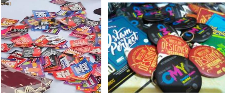
Gambar (2.4) stiker saat di pameran

lain. dibawah ini merupakan contoh stiker dan pin yang telah diproduksi oleh divisi media Muslim Designer Community.