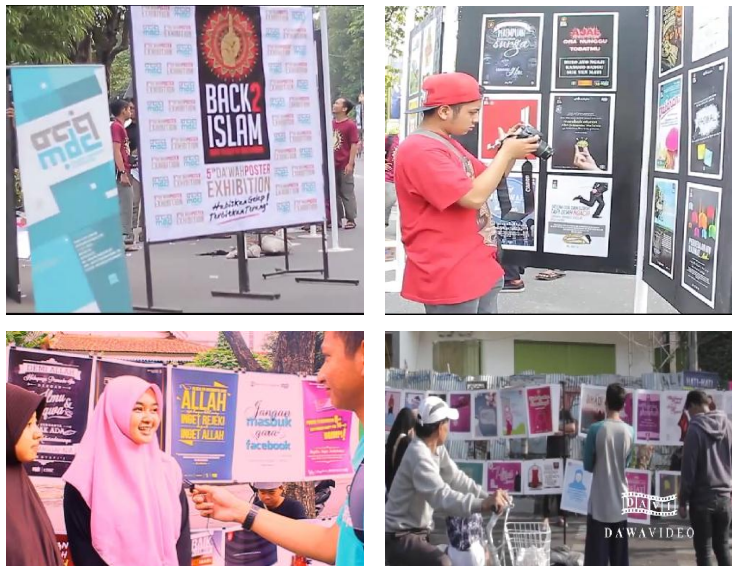
Gambar (2.3) Poster saat di pameran

C.E.O yang terfokus pada amanah exhibition atau mengadakan pameran. Saat ada tema dan acara tertentu produk desain grafis yang telah di buat oleh para desainer akan di cetak untuk kegiatan dakwah.