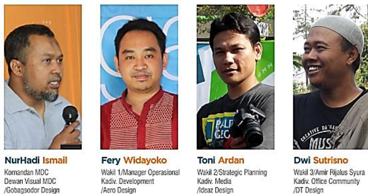
Gambar (2.2) Founder dari MDC

Founder of MDC terdiri dari empat sekawan desainer muslim solo yang kemudian berbagi peran dalam struktur kepengurusan, antara lain adalah :