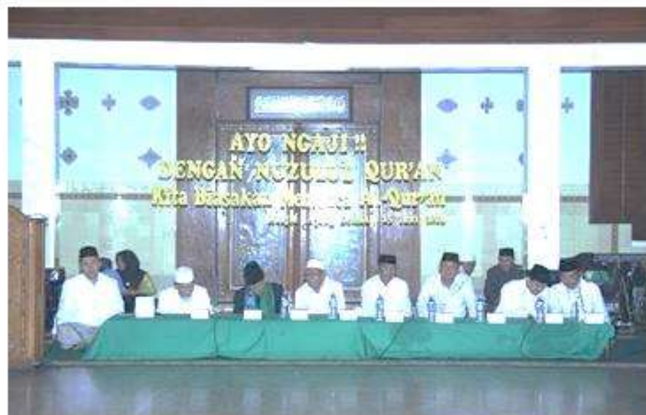
Acara pengajian Nuzulul Qur'an