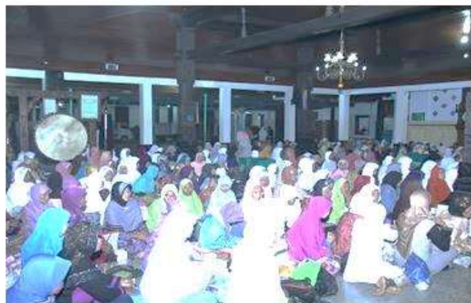
Pengajian Nuzulul Qur'an