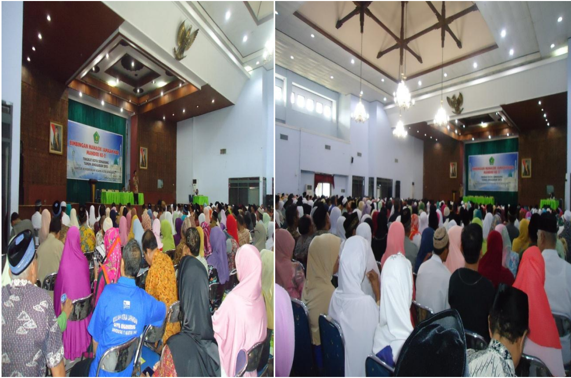
Jamaah saat mendengarkan Pembimbing menjelaskan materi