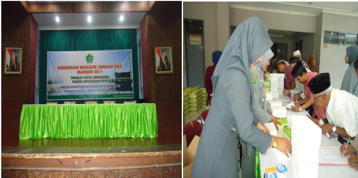
Kegiatan Bimbingan Ibadah Haji Tingkat KotaI dan Pemberian Snnack Pada Jamaah