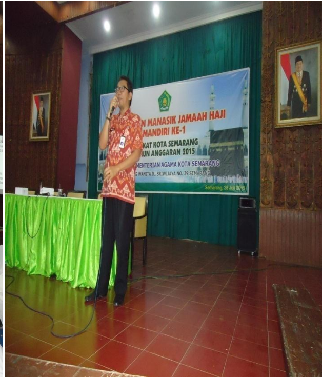
Pembimbing saat memberikan materi untuk jamaah haji