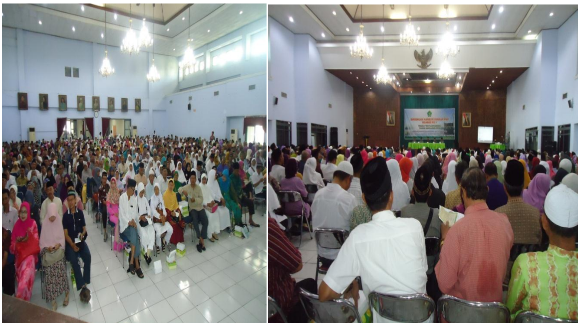
Jamaah Haji pada saat menerima Materi dari Pembimbing