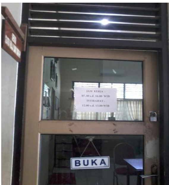
Seksi Gara Haji dan Umrah Umrah