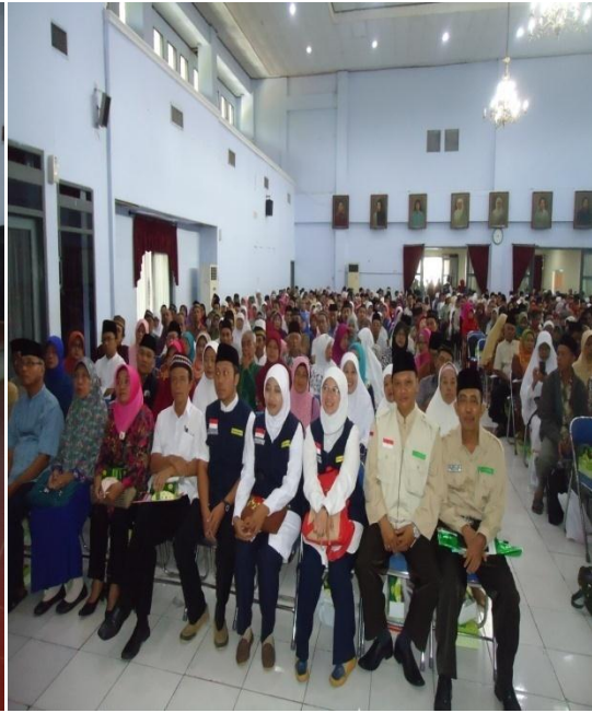
Jamaah Haji saat Mendengarkan Pengarahan Dari Pembimbing