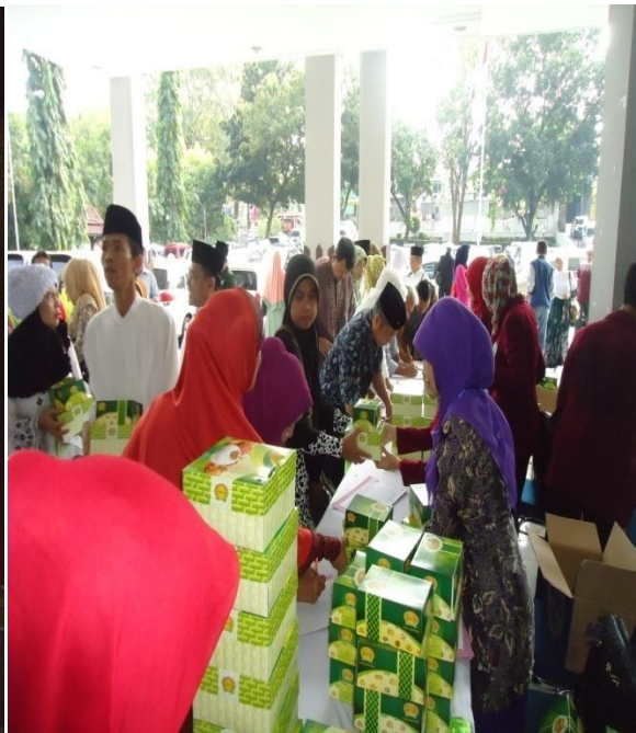
Kegiatan Bimbingan Ibadah Haji Tingkat Kota II dan Pemberian Snack pada Jamaah