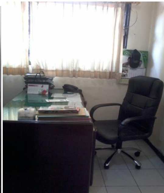
Ruang Kerja Kasi Gara Haji dan Umrah