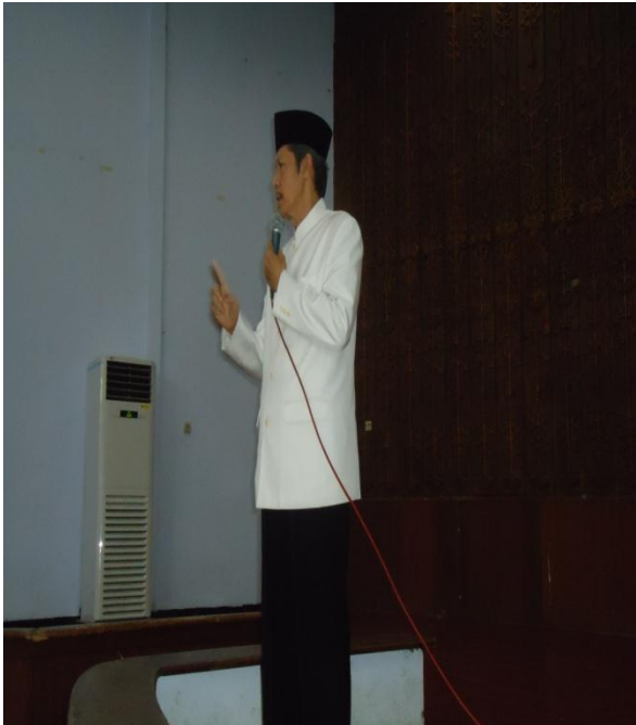
Pembimbing saat menjelaskan materi Bimbingan