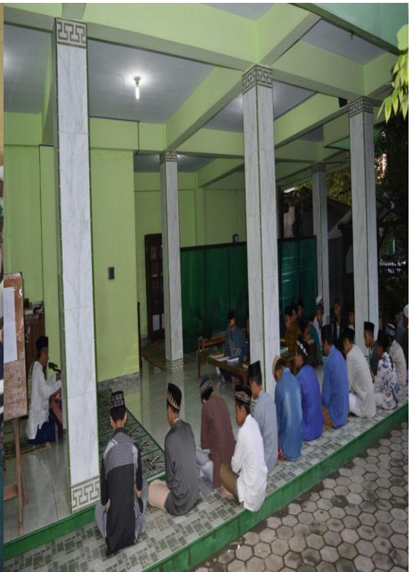
Kegiatan Ziarah Muharram dan Mengaji Kitab