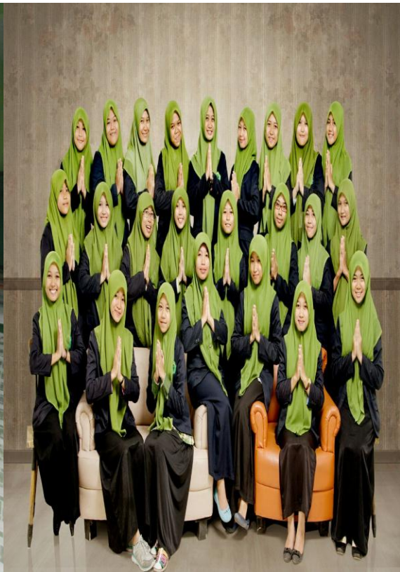
Santri Putra-Putri Pondok Pesantren Salafiyah Al Munawwir Pedurungan