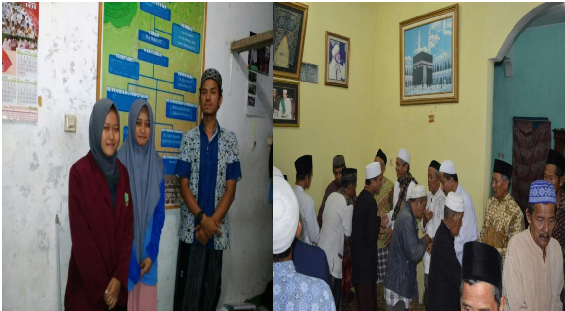
Pada Saat Wawancara dengan Pengurus Pondok Pesantren dan Mujahadah Alumni