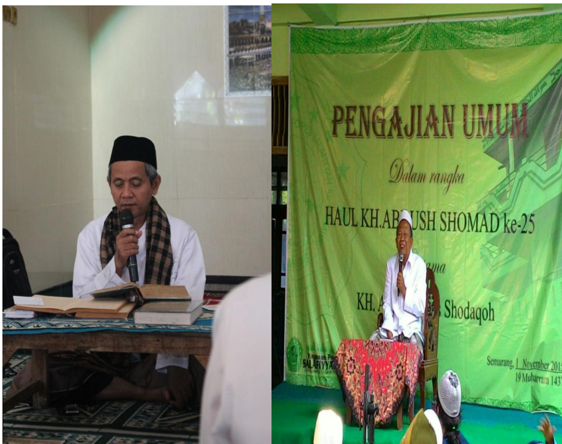
Pengasuh Pondok Pesantren Salamuna dan Kegiatan Pengajian Pondok Pesantren