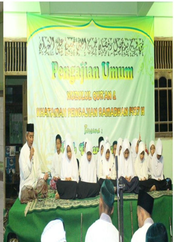
Kegiatan Haul Mbah Munawir dan Mbah Shomad dan Kegiatan Ramadhan