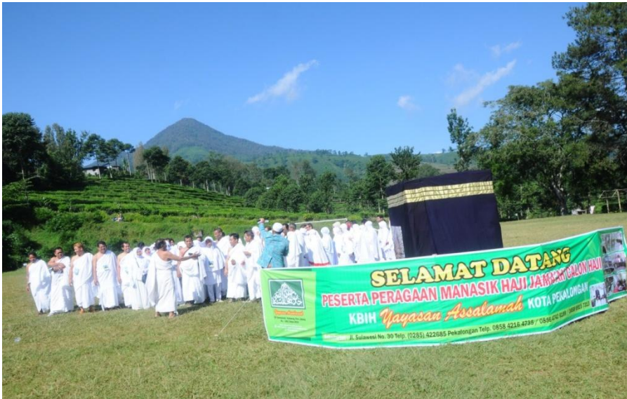
Gambar: Acara peragaan manasik haji