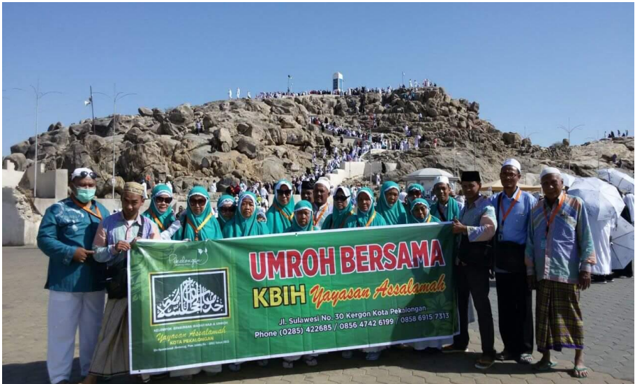
Gambar: Jamaah umroh KBIH Yayasan Assalamah