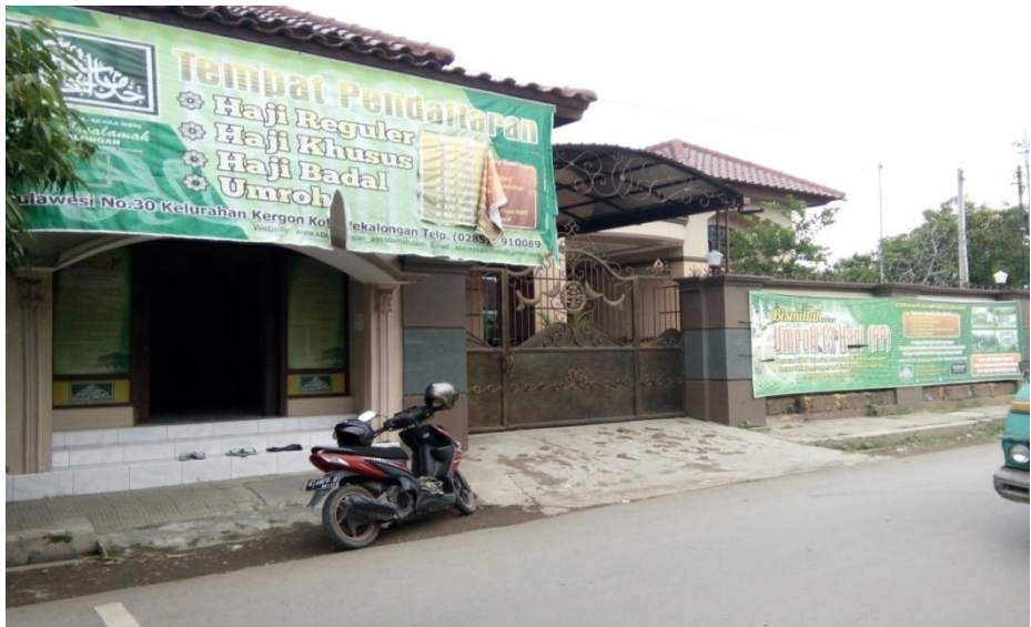
Gambar: Kantor sekretariat KBIH Yayasan Assalamah