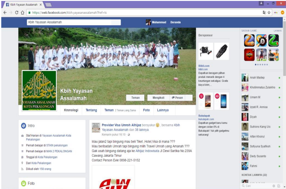
Gambar: Laman Facebook KBIH Yayasan Assalamah