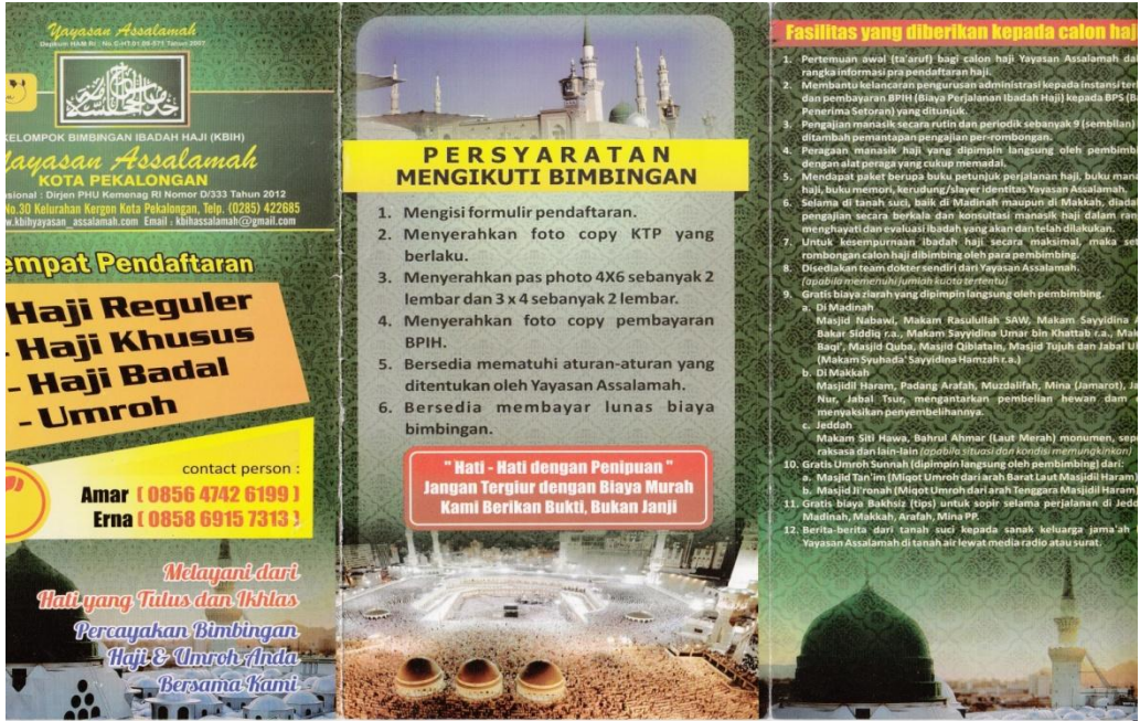
Gambar: Brosur KBIH Yayasan Assalamah