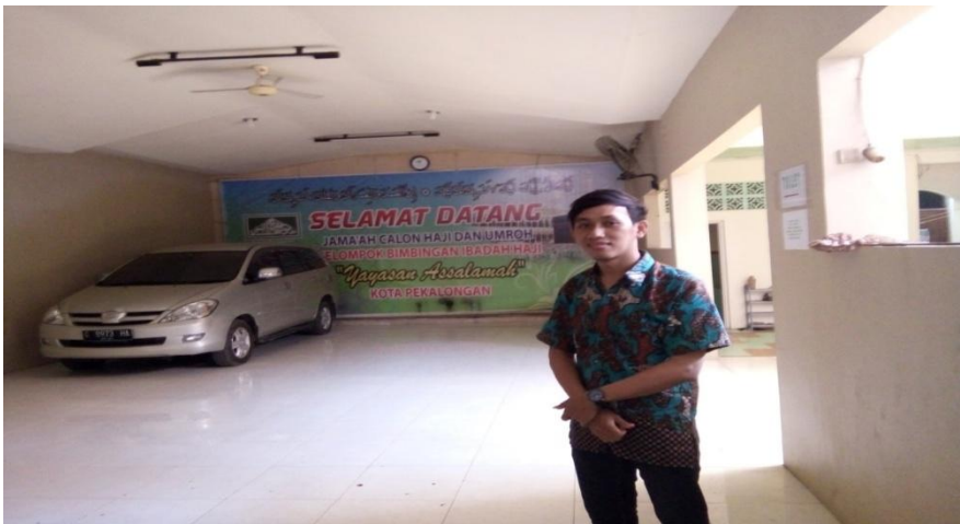
Gambar: Aula KBIH Yayasan Assalamah