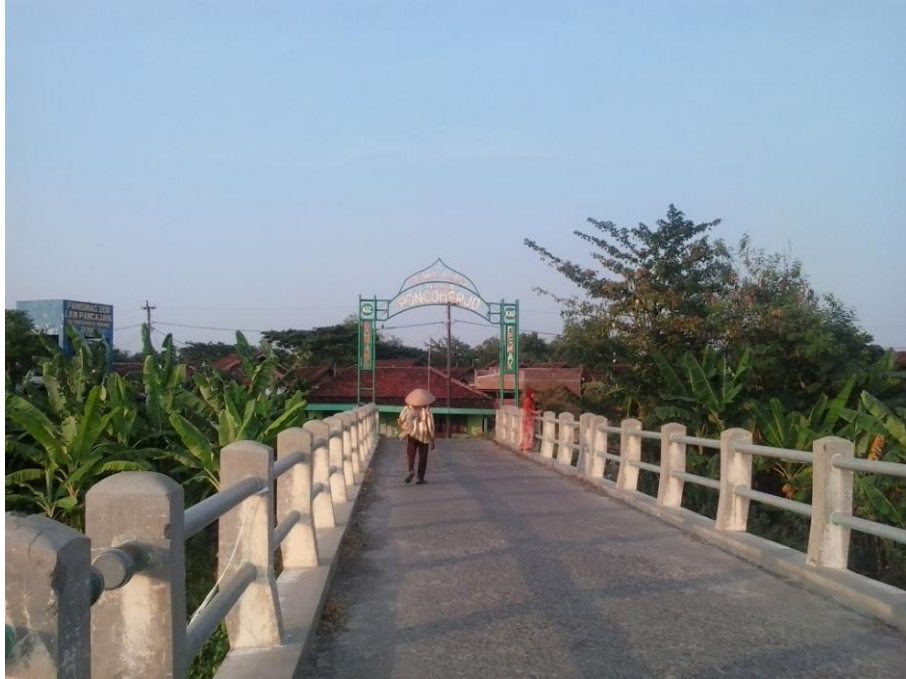
Halaman Rumah Desa Poncoharjo