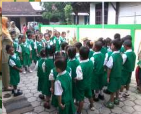
Upacara Hari Senin