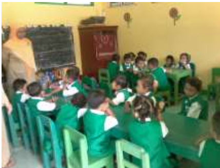
Kegiatan Membaca Surat Pendek