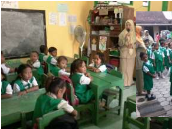
Berdo'a Sebelum Pelajaran