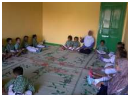
Kultum Bulan Ramadhan