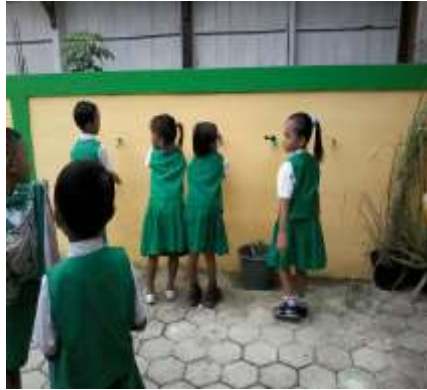
Cuci Tangan Sebelum Masuk Kelas