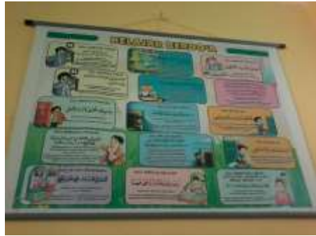
Media Pembelajaran Agama Islam Media Pembelajaran Agama Islam