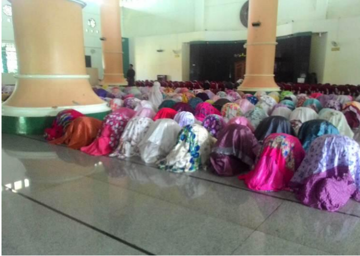
Pelaksanaan sholat dzuhur berjamaah yang dilakukan anak-anak bersama guru-guru