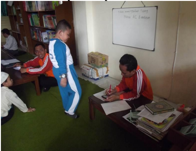
Pelaksanaan dan penilaian praktek adzan yang dilakukan anak-anak