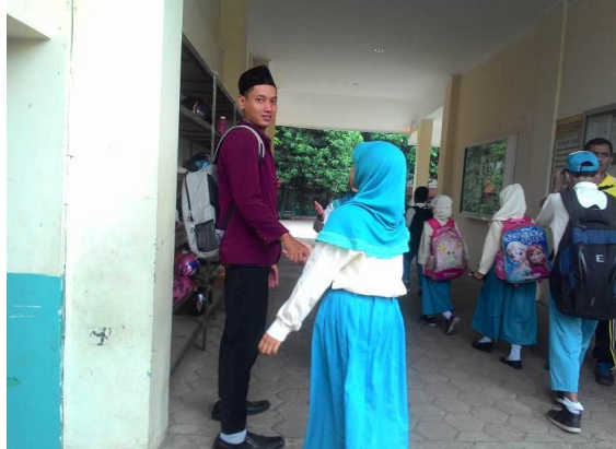
Siswa bersalaman dengan guru dengan mencium tangan dan mengucapkan salam