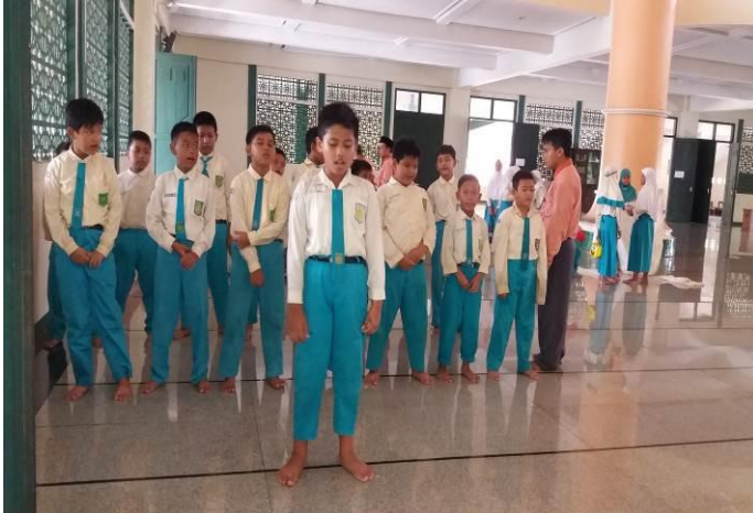
Pelaksanaan pembinaan kepada siswa yang telat berjamaah dan pada saat berjamaah belum bisa tertib oleh waka kesiswaan