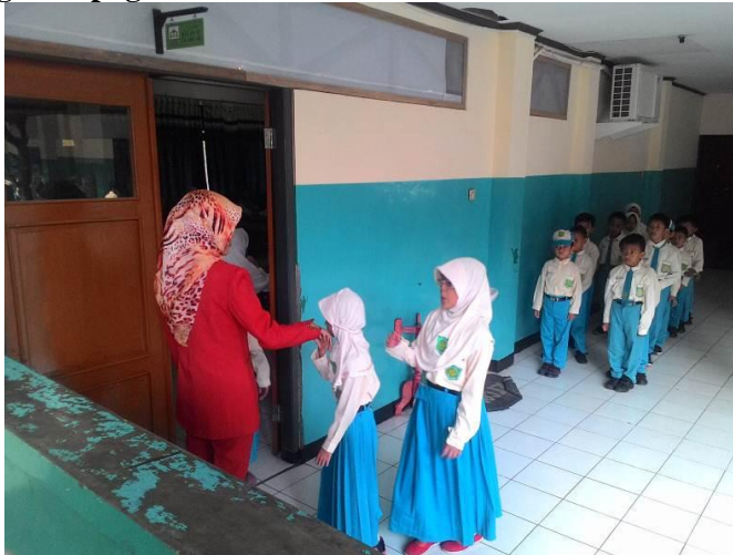
Pelaksanaan pembacaan surat-surat pendek, hadist, serta doa-doa harian sebelum masuk kelas