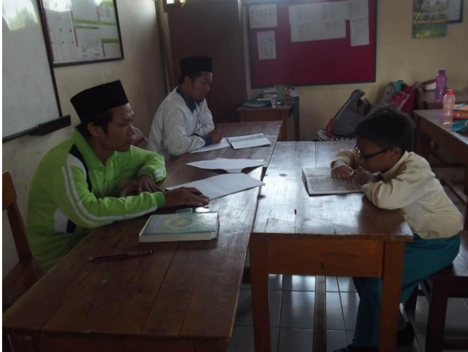
Pelaksanaan dan penilaian praktek mengaji yang dilakukan anak-anak