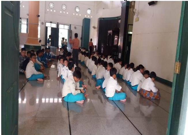
Pelaksanaan dzikir bersama setelah sholat berjamaah dzuhur yang dibimbing para guru