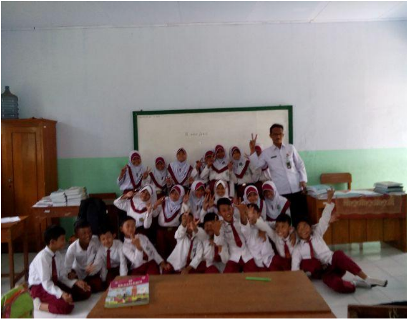
Foto Bersama dengan siswa kelas V C dan wali kelas