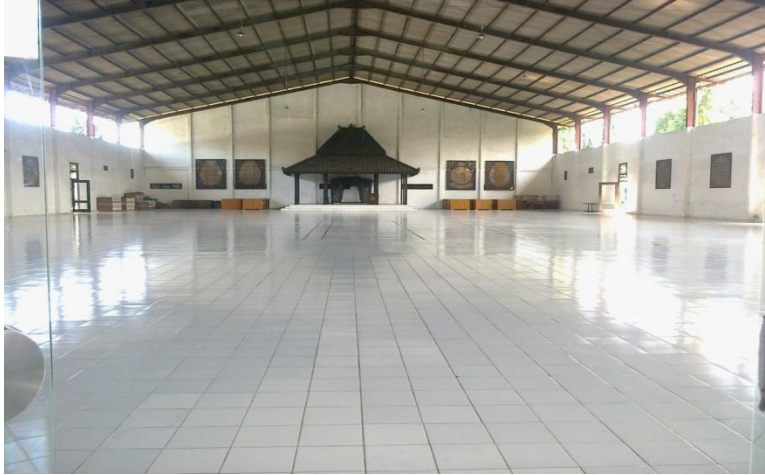
Gedung Serbaguna/ Aula