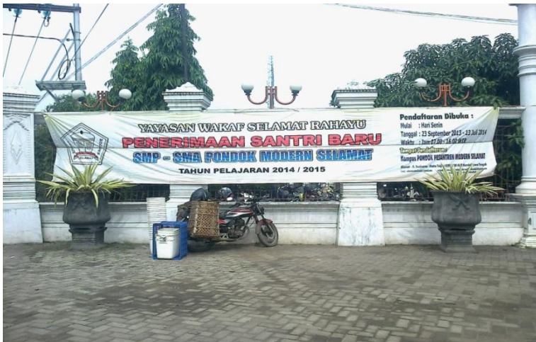
Pemasangan Spanduk Promosi