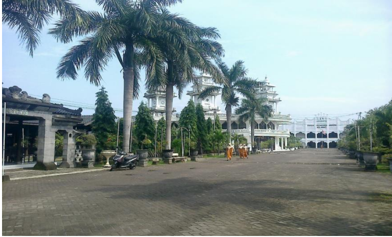
SMP Pondok Modern Selamat Kendal