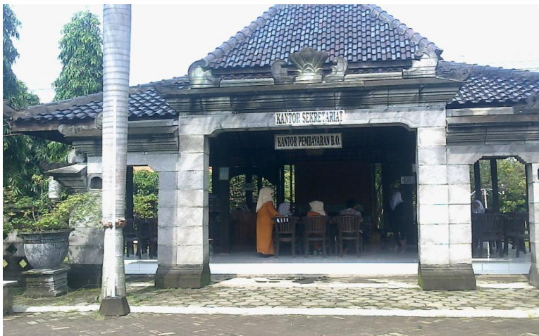
Gedung Pembayaran Administrasi