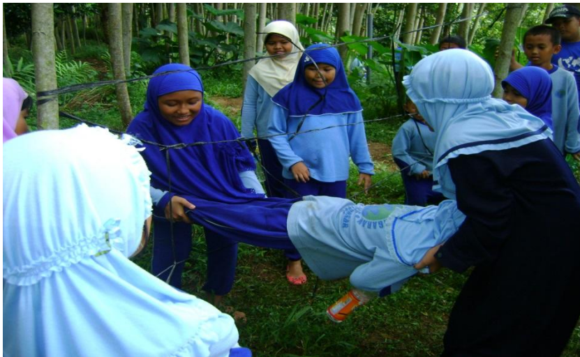
Kegiatan pembelajaran out bond