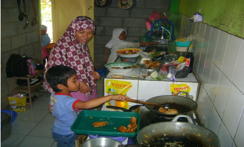
Kegiatan pembelajaran cooking