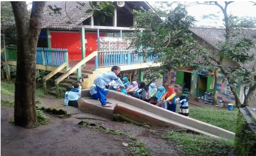
Kegiatan pembelajaran olahraga