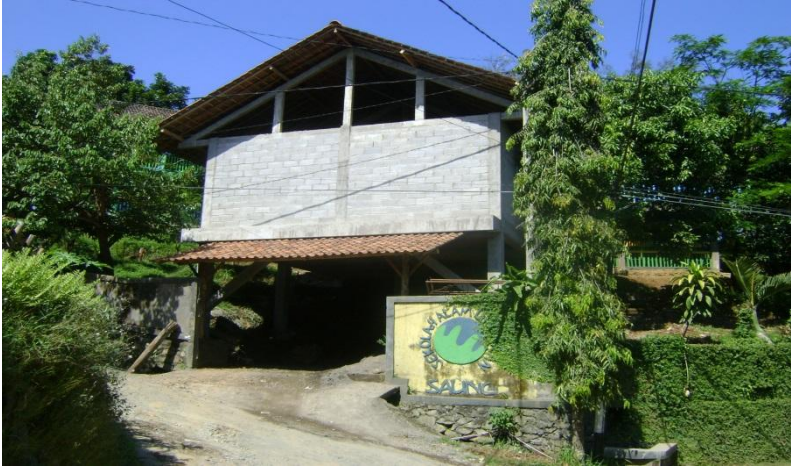
Gambar Bangunan Sekolah Alam Ungaran