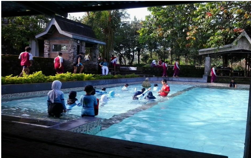
Kegiatan pembelajaran berenang