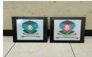
Cahaya Parfum & Nelart Hand Made