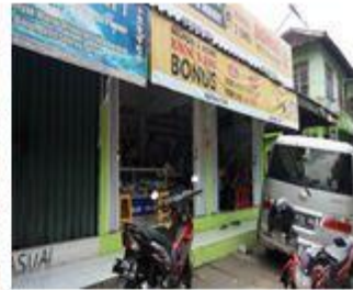
Aufa Gadget & Konter Hp Barokah Seluler