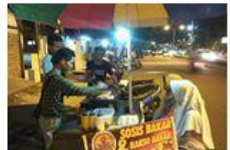
Tas Blub & Sosis Bakar Bakar Bang Fandil