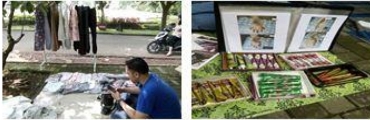
Sie Store & Lukis Henna Art