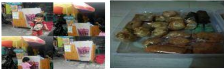
Asetehe Kebocoran & Jajanan Snack Amanah