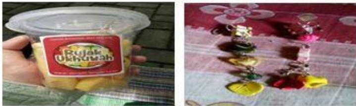
Rujak Ukhuwah & Peniti Bros Nilna Colection