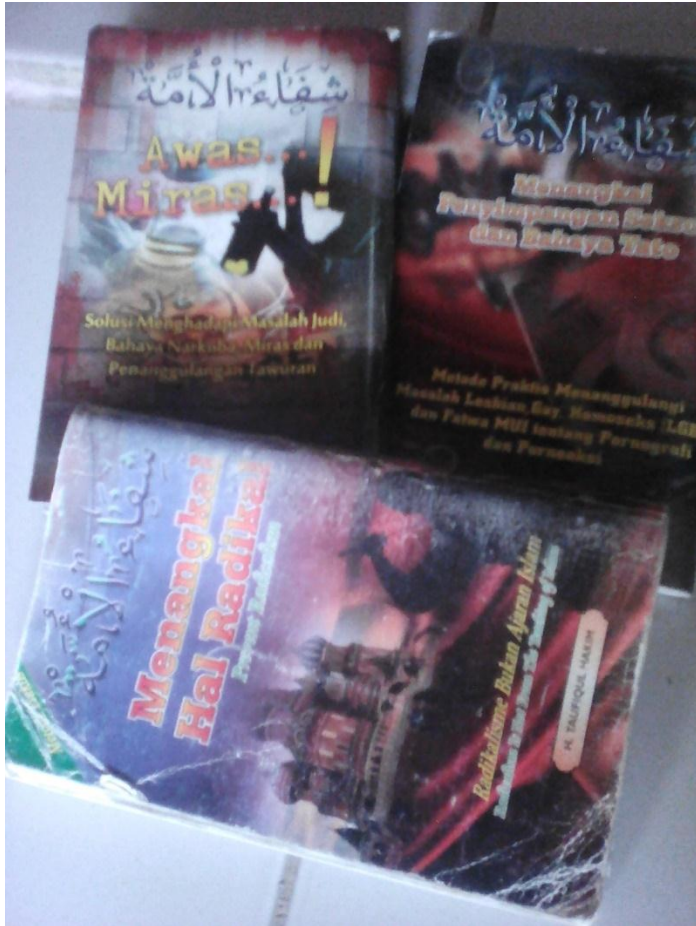
Gambar: Serial Buku Syifa'ul Ummah