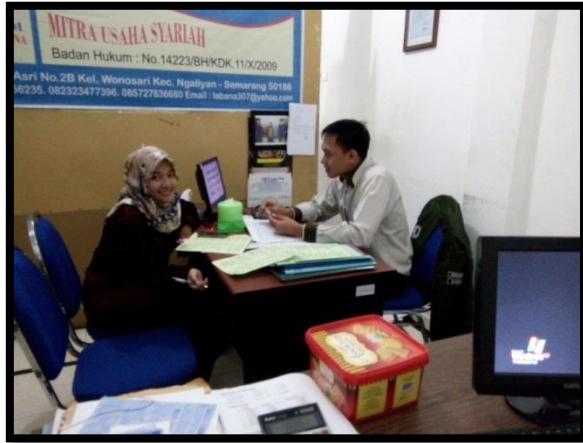
Proses wawancara di KSPPS BMT El Labana Semarang