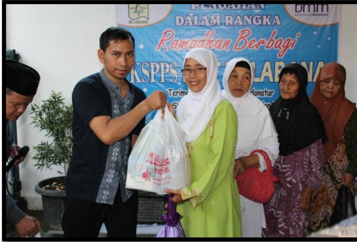
Kegiatan Ramadhan Berbagi 2017 yang diadakan oleh KSPPS BMT El Labana Semarang