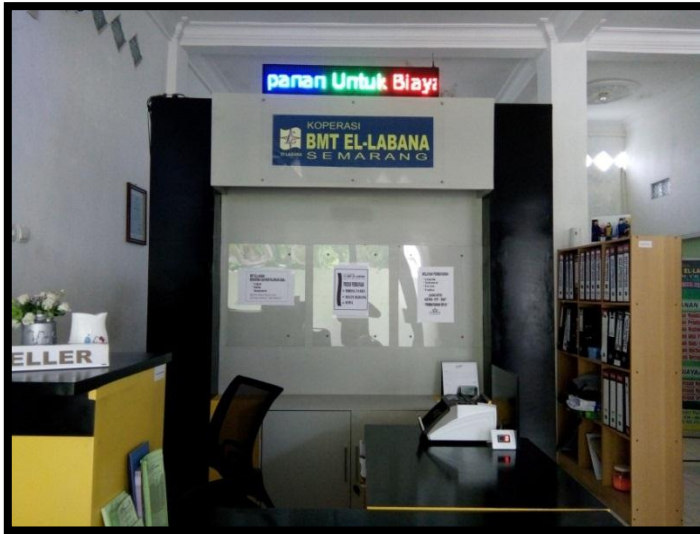
Kantor KSPPS BMT El Labana Semarang