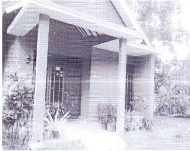
Gambar 4: Rumah Bapak Heri Ismanto