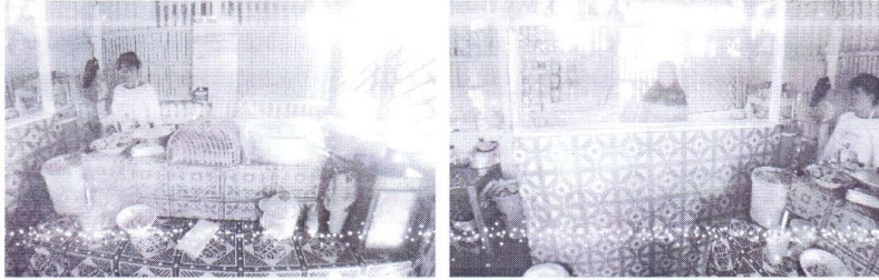
Gambar 1: Warung Ibu Sujati