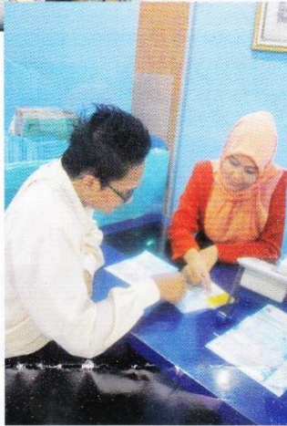
Customer service memberikan penjelasan mengenai pembiayaan kepada nasabah