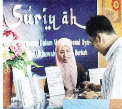
Pelayanan Nasabah di Teller