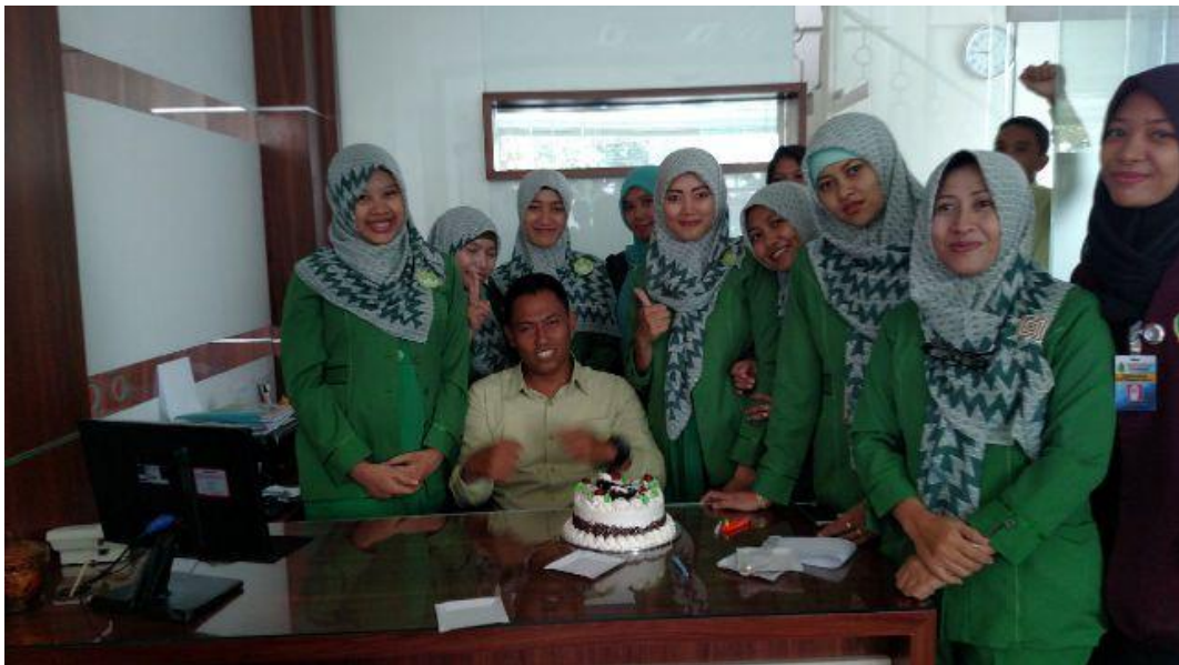
Gb. 1.2 Foto saat perayaan ulang tahun karyawan bagian Account Officer