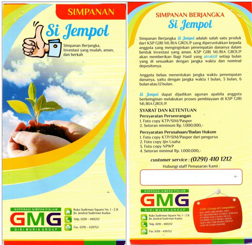
Gb. 1.9 Brosur Simpanan Berjangka KSP Giri Muria Kudus