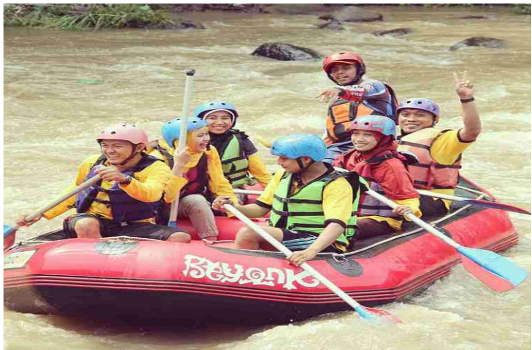
Gb. 1.4 Pelaksanaan Motivasi Kerja Berupa Outbond