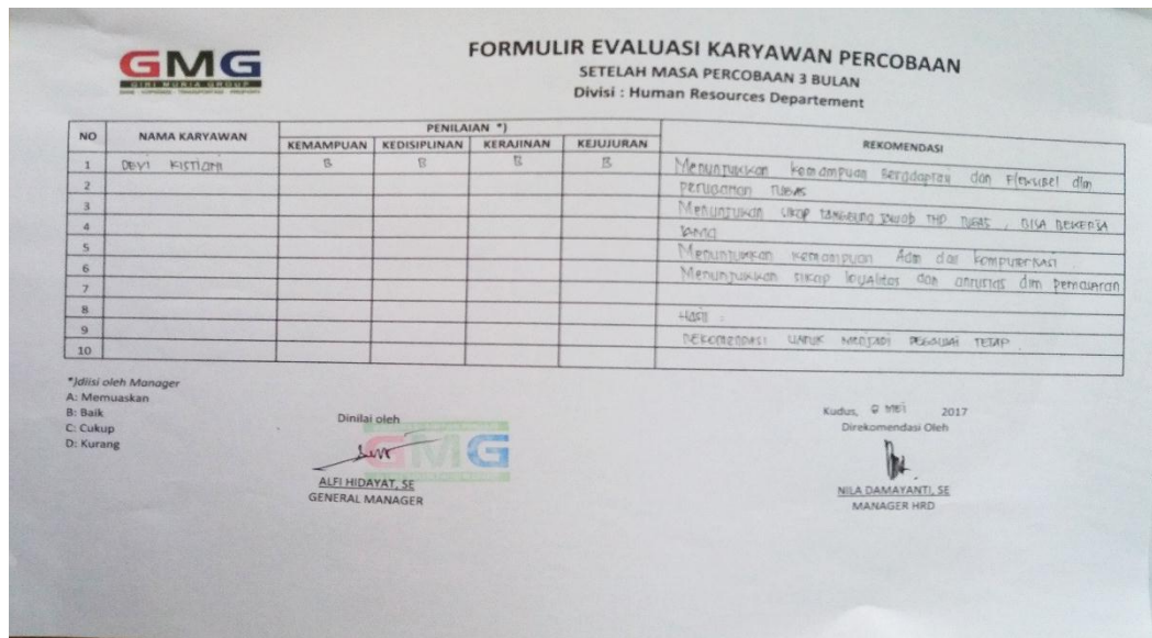
Gb. 1.6 Formulir Evaluasi Karyawan Percobaan Kantor Pusat