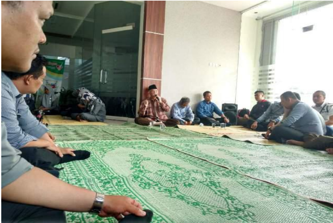
Gb. 1.3 Foto Pelaksanaan Motivasi Kerja Berupa Pengajian Selapanan