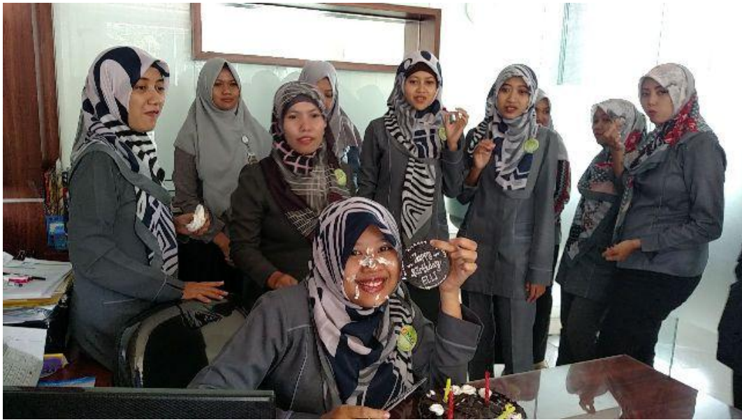
Gb. 1.1 Foto saat perayaan ulang tahun karyawan bagian Teller