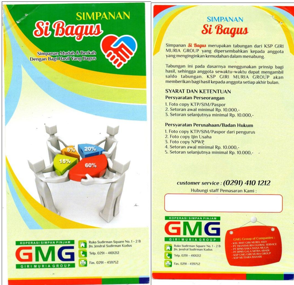
Gb. 1.8 Brosur Simpanan (Si Bagus) KSP Giri Muria Kudus