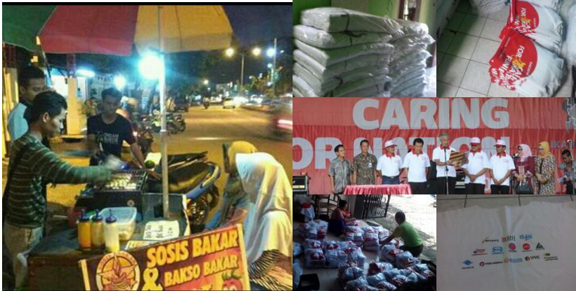
SOSIS BAKAR & BAKSO BAKAR BANG FANDHIL “SI TUKANG KAOS” KONVEKSI