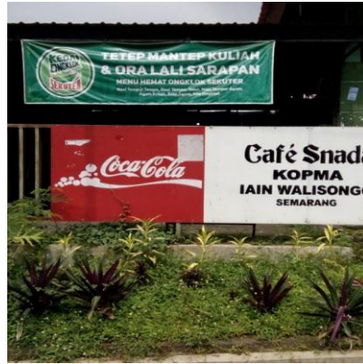
KEDAI ONGKLOK SEKUTER