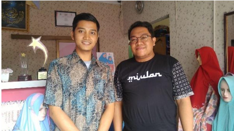
Contoh Foto Produk Miulan Hijab: Dokumentasi Penelitian di Miulan Hijab Semarang