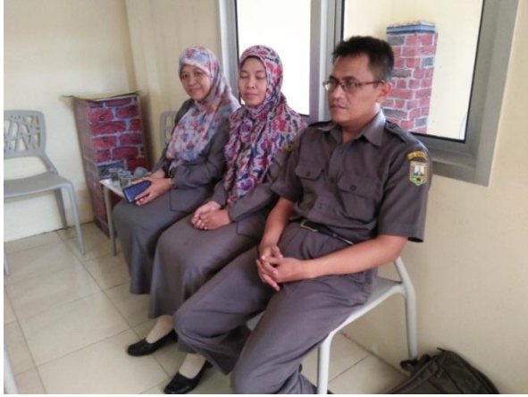
Petugas Rohani RSUD Ambarawa