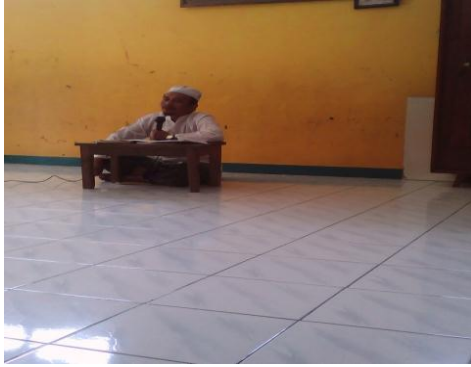
Kyai memberikan bimbingan