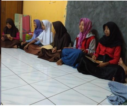
bimbingan kepada remaja