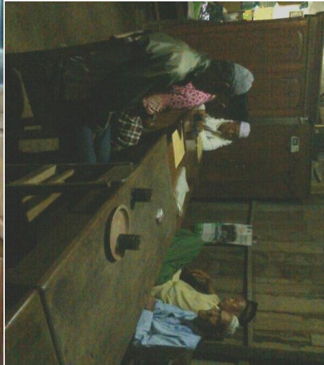
Konseling Keluarga (konsultasi/mediasi) Bimbingan Bapak-Bapak