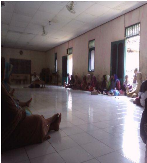
Pembinaan Khaira Ummah