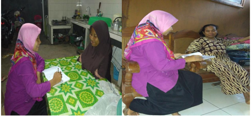
Proses wawancara dengan keluarga R dan ibu P