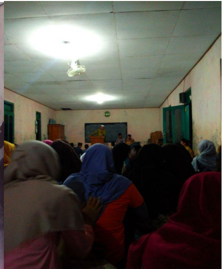
Bimbingan Remaja Putra dan Putri