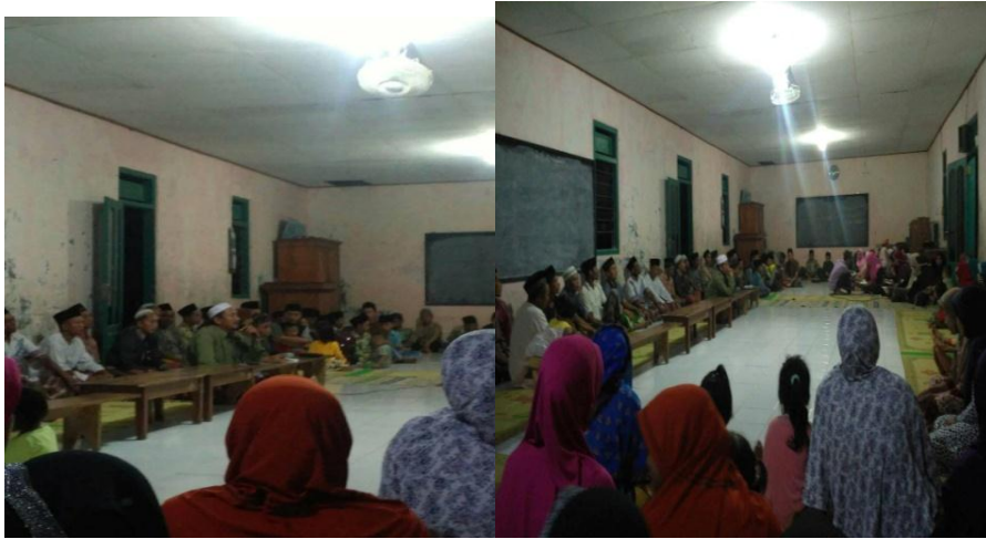
Pembinaan keluarga sakinah kepada semua anggota keluarga