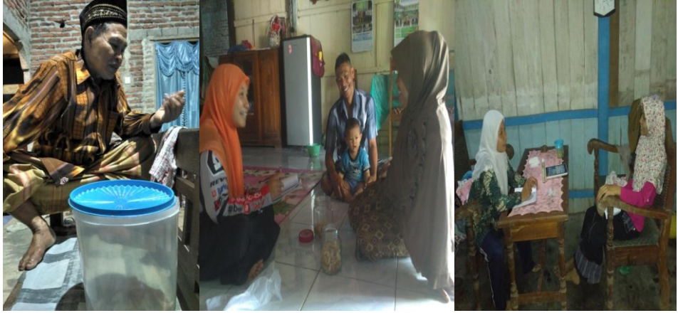
Proses wawancara dengan keluarga J , A & S, dan Z