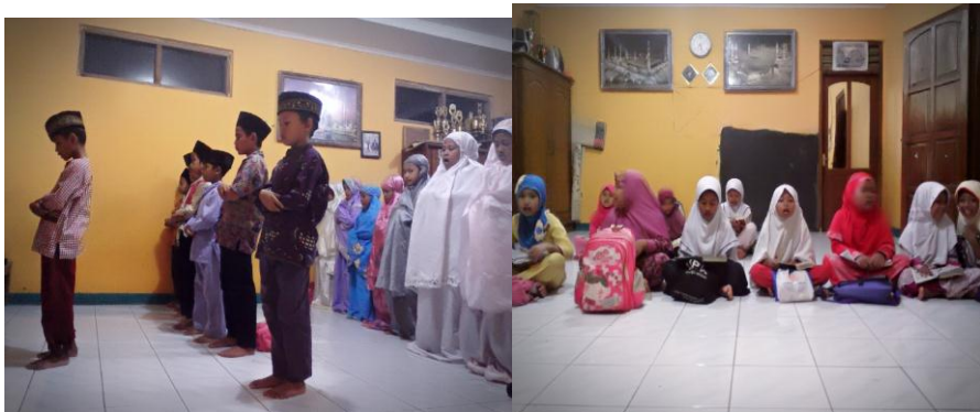
Bimbingan ibadah sholat