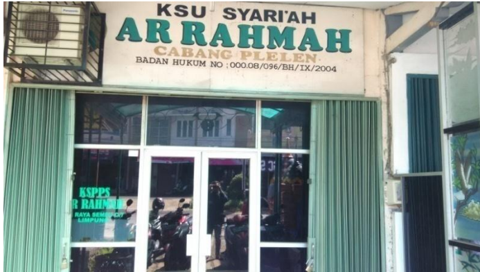
KSPPS Ar – Rahmah Kantor Kas Cabang Limpung