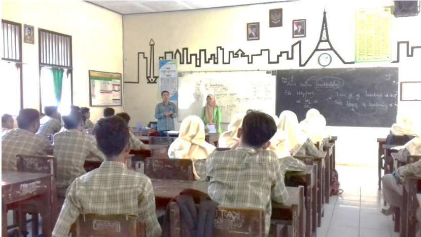
Uji Coba Angket