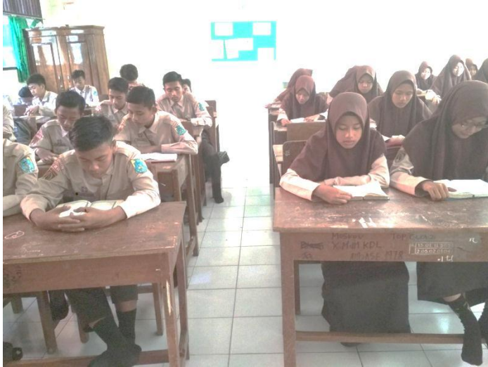
Proses Pembiasaan Tadarus Al-Qur'an