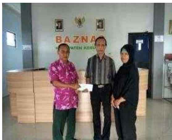
Gambar Program Kebumen Makmur (Bantuan untuk para usaha ekonomi produktif)