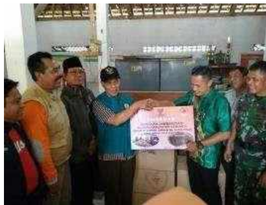
Gambar Program Kebumen Peduli