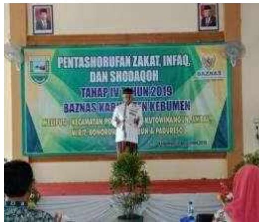
Gambar Program Kebumen Taqwa (Siraman Rohani dan acara Pentashorufan di Kantor/ Dinas/ Sekolah di lingkungan Pemerintah Kabupaten Kebumen)