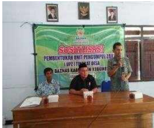
Gambar Sosialisasi pembentukan Unit Pengumpulan Zakat (UPZ) Tingkat Desa BAZNAS Kabupaten Kebumen