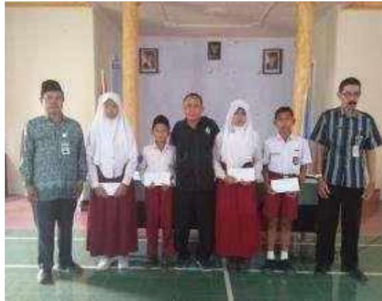
Gambar Program Kebumen Cerdas (Bantuan Beasiswa Pendidikan)