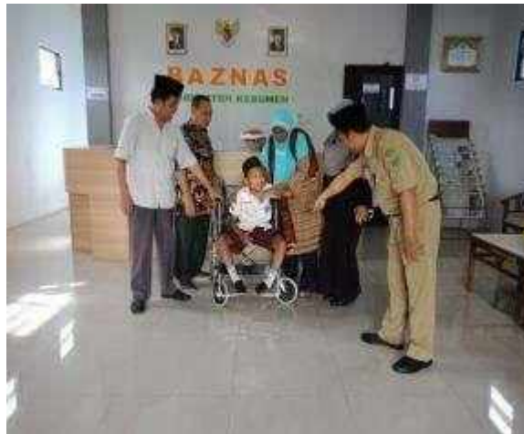
Gambar Program Kebumen Sehat (Bantuan Penunjang Kesehatan)