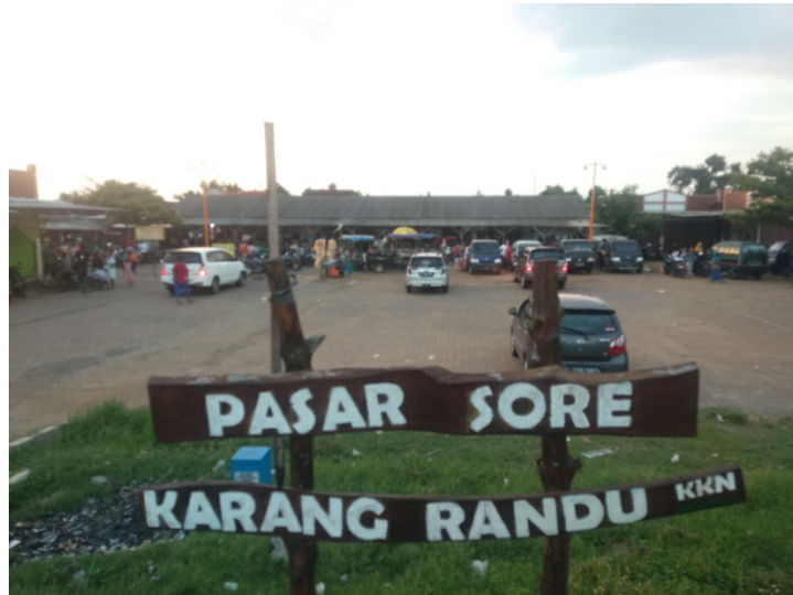
Gambar 5 : Pasar Sore Karangrandu

Gambar diatas merupakan plang pasar sore karangrandu, walaupun sedikit kumuh dan jelek, plang inilah yang menjadi idaman bagi para wisatawan datang kesini untuk berpose foto dengan plang pasar sore karangrandu, keadaan setiap sore nya dipasar sore karangrandu cukup lumayan banyak apalagi kalau menjelang hari weekend yaitu hari sabtu dan minggu, pasar ini dibanjiri banyak orang untuk menikmati kuliner khas Desa Karangrandu.