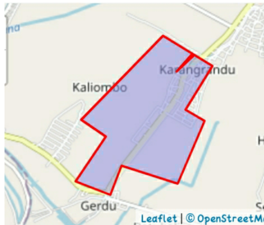
Gambar 1

Desa Karangrandu merupakan salah satu desa di Kecamatan Pecangaan Kabupaten Jepara. Ditinjau dari segi geografis wilayah Desa Karangrandu berada di sebelah selatan Ibukota Kabupaten Jepara dengan jarak tempuh sekitar 2 kilo meter ke ibukota kecamatan dan 15 kilometer ke ibukota kabupaten serta dapat ditempuh dengan kendaraan kurang lebih 35 menit. Desa Karangrandu memiliki batas desa sebagai berikut: