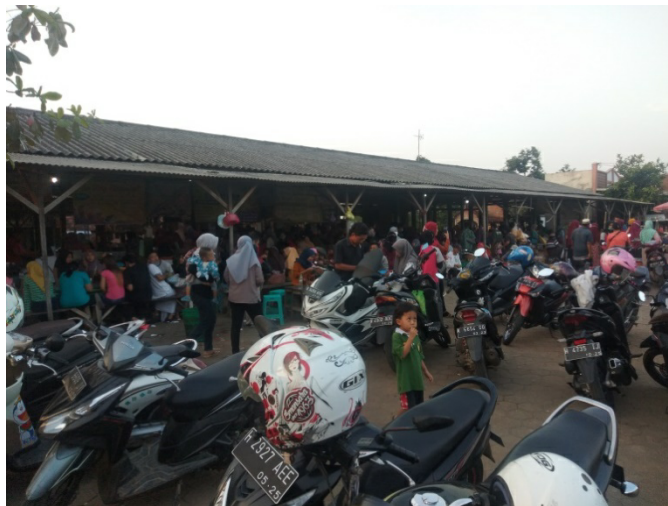
Gambar 8 : Tempat parkir Pasar Sore Karangrandu

Selain memperbaiki dari segi usaha, pendapatan, dan kehidupan, nyatanya Pemerintah Desa Karangrandu juga memperbaiki keadaan lingkungan desa. Karena kerusakan lingkungan seringkali disebabkan oleh kemiskinan atau pendapatan yang terbatas. Jalan yang awalnya digunakan menjadi tempat berjualan oleh pedagang sekarang terlihat lebih bersih dan rapi. Jalan yang sebelumnya sering terjadi kemacetan sekarang terlihat ramai lancar tanpa adanya halangan. Dengan begitu masyarakat yang ingin berkunjung ke Pasar Sore Karangrandu menjadi lebih nyaman ketika melewati jalan tersebut.