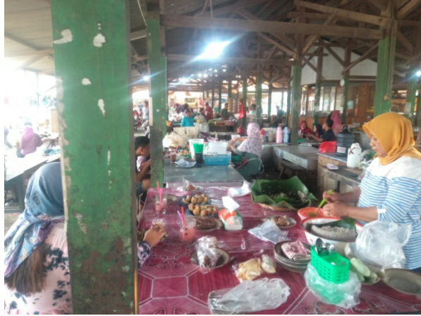
Gambar 7: Wawancara dengan Ibu Maryani

Nama dari pedagang yang kedua ini adalah Ibu Maryani, dalam segi pendapatan setiap hari nya hampir sama dengan Ibu Sholikaturun, yang menjadi perbedaan adalah dulunya beliau ibu rumah tangga, kenapa beliau bisa menjadi pedagang, alasannya adalah sebelum beliau jadi pedagang disini dulu orang tua beliau sudah menjadi pedagang disini kemudian karena keadaan orang tua beliau yang sudah lanjut usia, maka yang meneruskan kerja orang tua adalah ibu maryani, beliau menggantikan orang tuanya sudah hampir 12 tahun menjadi pedagang disini