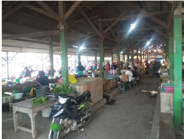
Gambar 9 : Lapak Pedagang Pasar Sore Karangrandu

ekonomi dan lingkungan. Setelah ekonomi dan lingkungan diperbaiki maka akan berdampak pada segi sosialnya, sehingga terwujud masyarakat yang sejahtera.