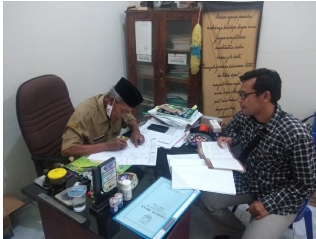
Gambar 3: Wawancara dengan Petinggi Desa

didirikan bangunan berupa pasar merupakan tanah yang sudah dilegalkan Pemerintah Provinsi untuk ditempati sehingga diharapkan tidak terjadi miss komunikasi antara pihak Pemerintah Desa dengan Pemerintah Provinsi.