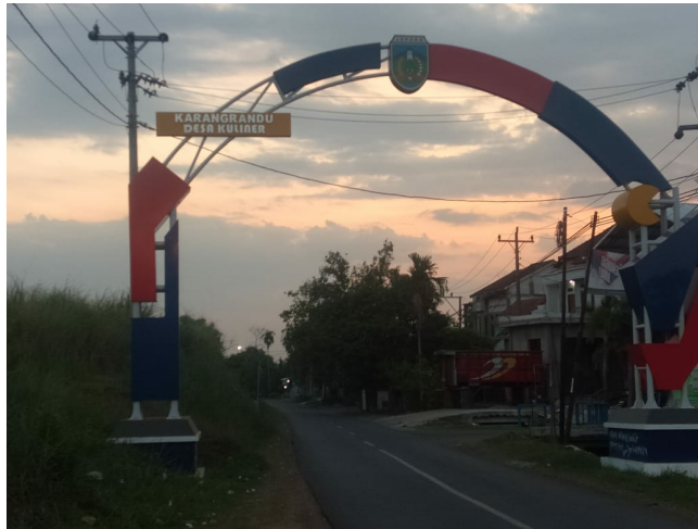
Gambar 4 : Gerbang Desa Karangrandu

Pemindahan pedagang dari pinggir jalan ke tempat yang telah disediakan oleh Pemerintah Desa nyatanya memberikan perubahan yang baik bagi Desa Karangrandu. Salah satunya yaitu membuat lingkungan Desa Karangrandu menjadi lebih bersih dan rapi. Berikut kutipan wawancara dengan Bapak Syahlan selaku lurah di Desa Karangrandu: