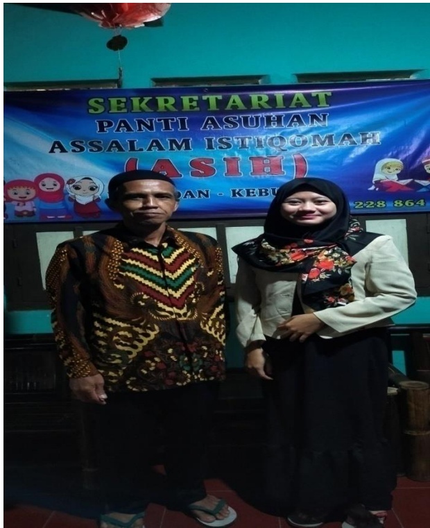
Foto 11. Wawancara dengan Pembimbing Agama di Panti Asuhan Assalam Istiqomah Kabupaten Kebumen