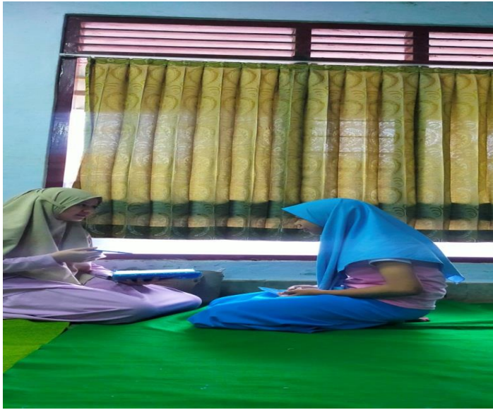
Foto 7. Wawancara dengan Informan di Panti Asuhan Assalam Istiqomah Kabupaten Kebumen