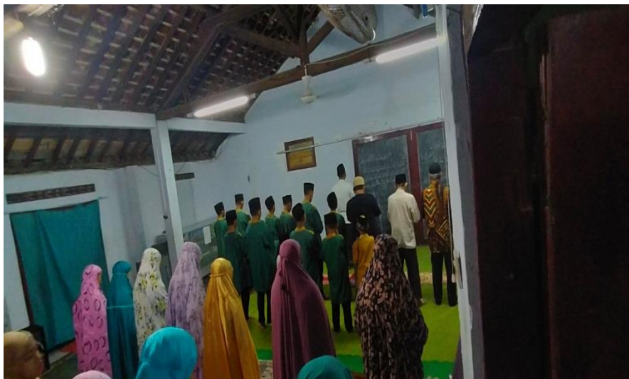
Foto 12. Kegiatan Sholat Jamaah di Panti Asuhan Assalam Istiqomah Kabupaten Kebumen