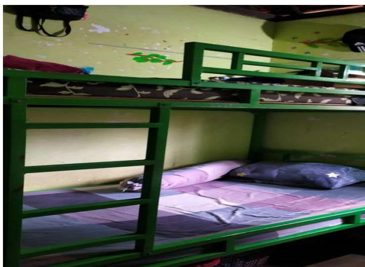
Foto 2. Kamar Tidur Putri di Panti Asuhan Assalam Istiqomah Kabupaten Kebumen