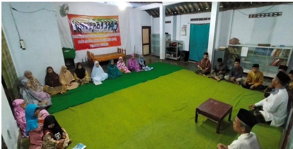
Foto 14. Kegiatan Pembinaan di Panti Asuhan Assalam Istiqomah Kabupaten Kebumen