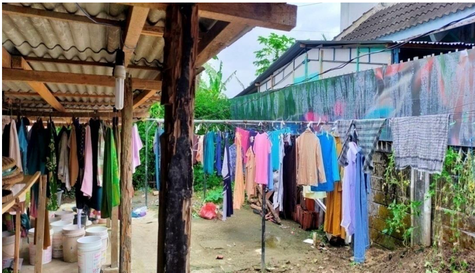
Foto 4. Halaman Jemuran Pakaian di Panti Asuhan Assalam Istiqomah Kabupaten Kebumen