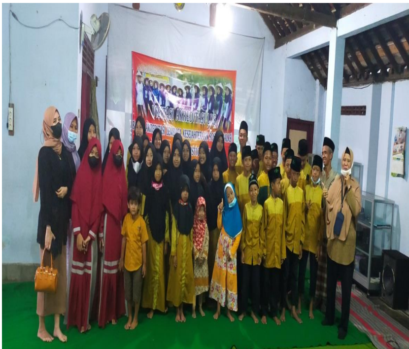
Foto 16. Foto Bersama Usai Kegiatan Kajian di Panti Asuhan Assalam Istiqomah Kabupaten Kebumen