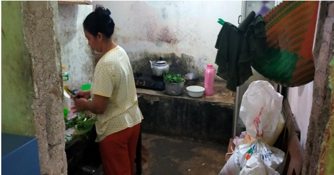
Foto 5. Kondisi Dapur di Panti Asuhan Assalam Istiqomah Kabupaten Kebumen