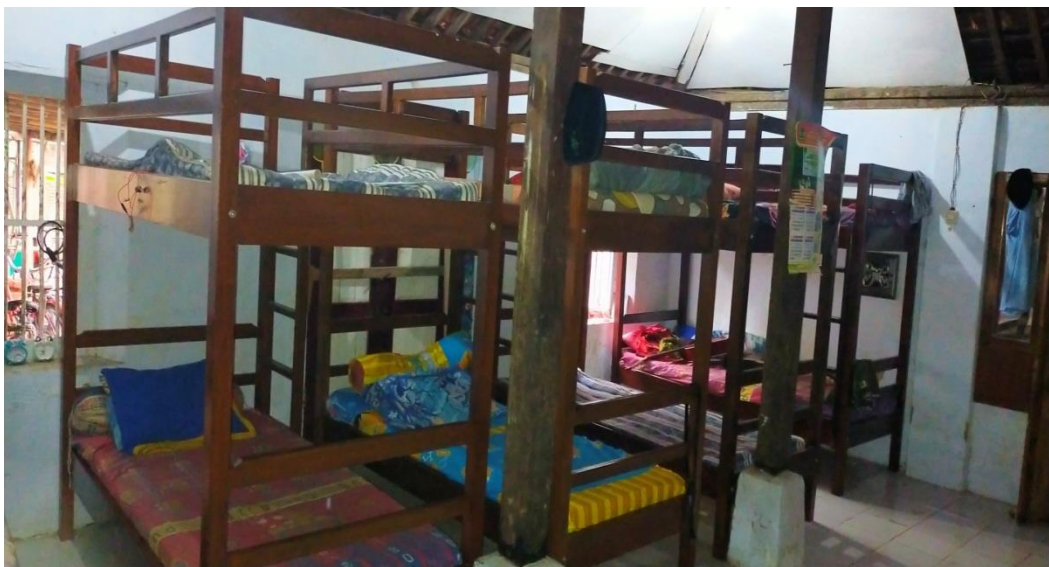
Foto 6. Kamar Tidur Putra di Panti Asuhan Assalam Istiqomah Kabupaten Kebumen