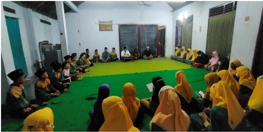
Foto 15. Kegiatan Ceramah di Panti Asuhan Assalam Istiqomah Kabupaten Kebumen