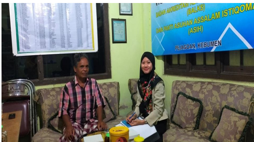
Foto 10. Wawancara dengan Ketua Panti Asuhan Assalam Istiqomah Kabupaten Kebumen