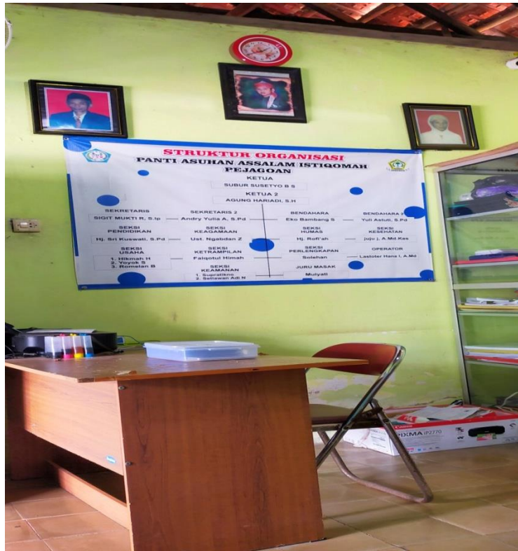
Foto 1. Ruang Pengurus Panti Asuhan Assalam Istiqomah Kabupaten Kebumen