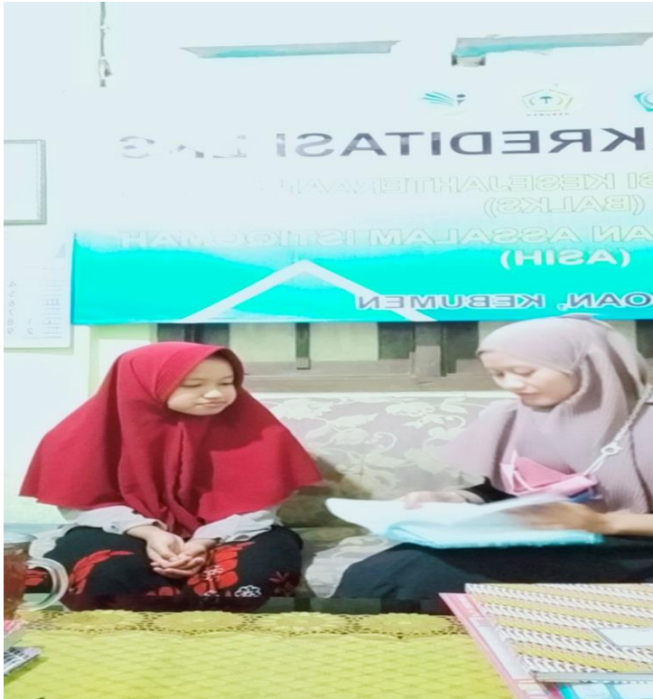
Foto 9. Wawancara dengan Informan di Panti Asuhan Assalam Istiqomah Kabupaten Kebumen