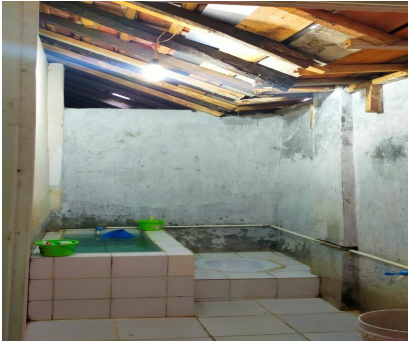
Foto 3. Kamar Mandi/WC di Panti Asuhan Assalam Istiqomah Kabupaten Kebumen