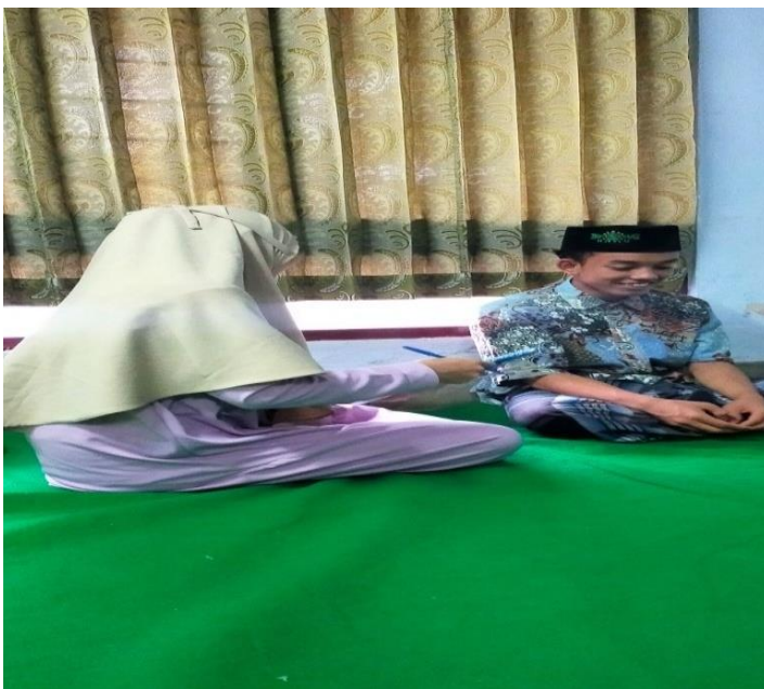
Foto 8. Wawancara dengan Informan di Panti Asuhan Assalam Istiqomah Kabupaten Kebumen