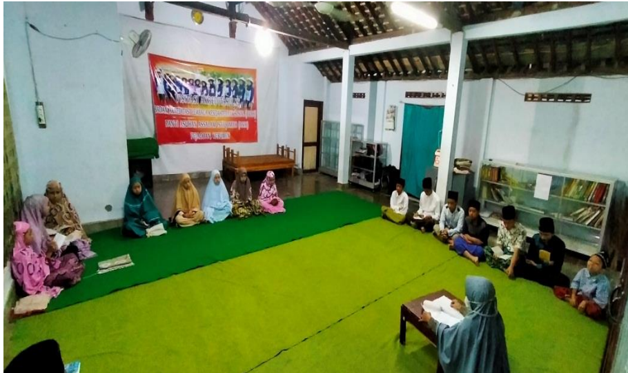
Foto 13. Kegiatan Bimbingan Agama di Panti Asuhan Assalam Istiqomah Kabupaten Kebumen