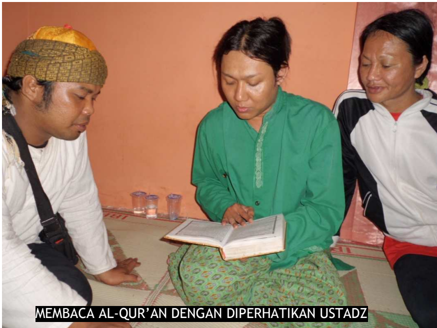
MEMBACA AL-QUR'AN DENGAN DIPERHATIKAN USTADZ