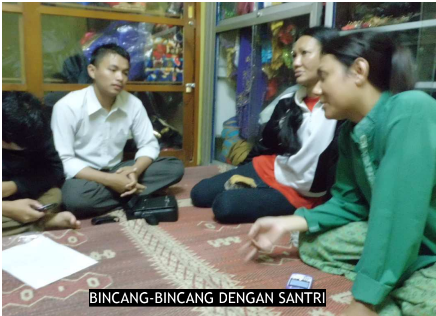
BINCANG-BINCANG DENGAN SANTRI