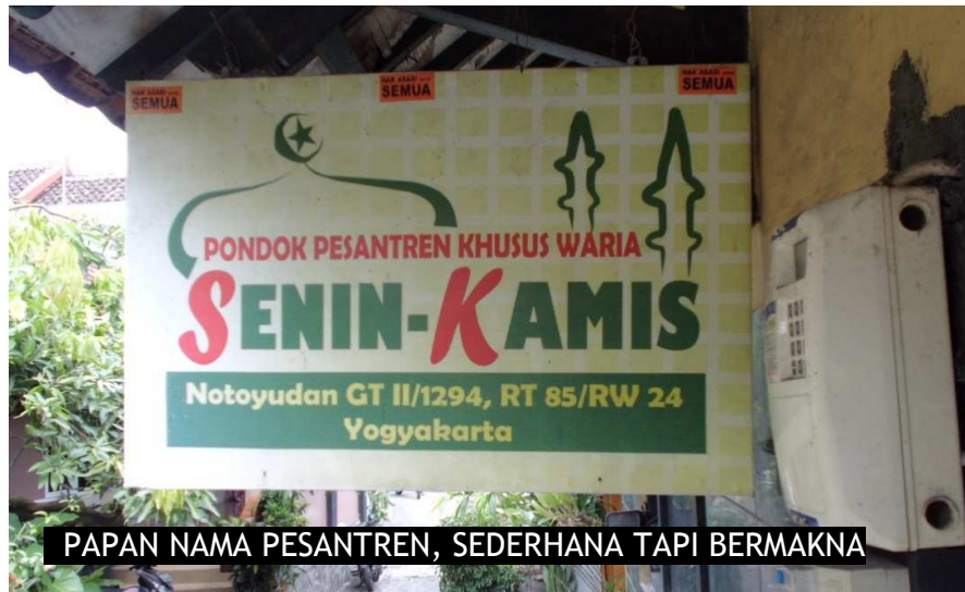
PAPAN NAMA PESANTREN, SEDERHANA TAPI BERMAKNA