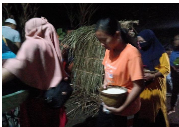
Prosesi mengelilingi omah-omahan oleh kerabat almarhum