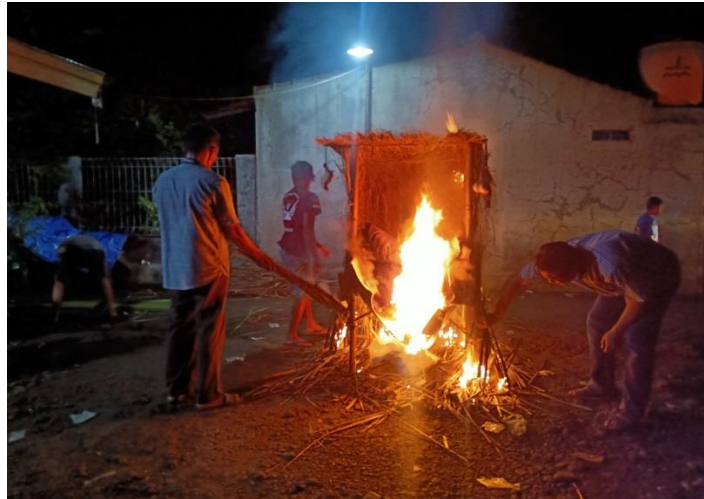
Membakar omah-omahan dan boneka pengantin