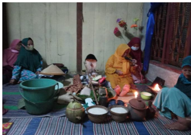
Prosesi andheg dalam upacara obong