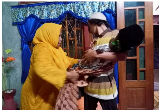
Boneka pengantin digendong oleh anak dari almarhum untuk persiapan lepasan