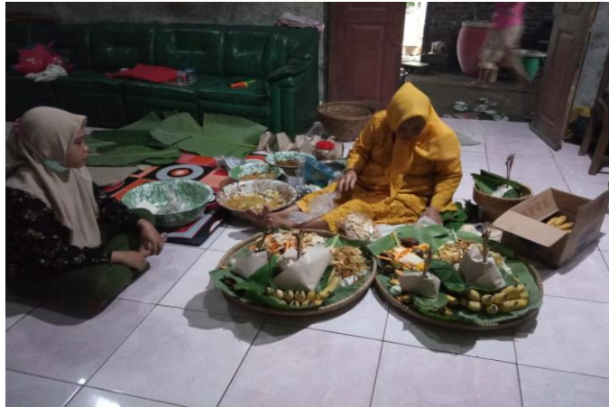
Sesaji yang digunakan upacara obong