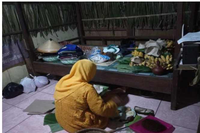
Kamar Kajang sebagai tempat tidur boneka pengantin dan tempat sesaji