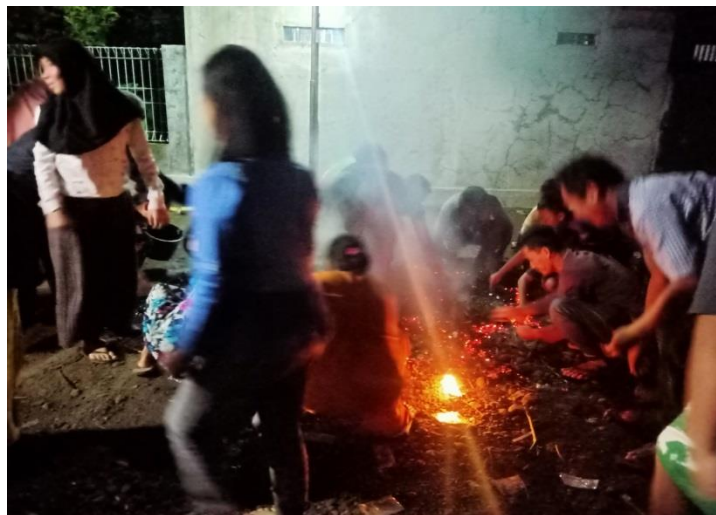
Royokan uang koin setelah diobong