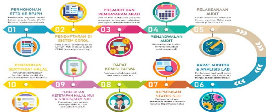
Alur Proses Sertifikasi Halal Pada Produk Makanan dan Minuman. 59

Secara Umum Prosedur Sertifikasi Halal adalah sebagai berikut: