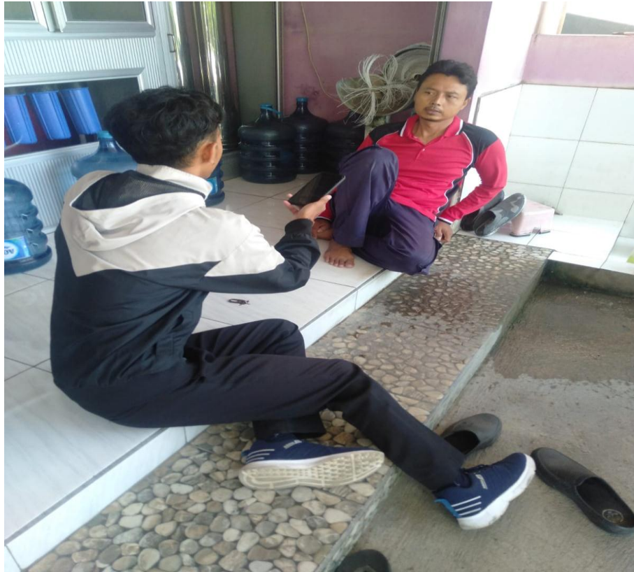
Wawancara dengan Pengurus/mandor Pengisian air di Blanten kecamatan Ungaran barat Kabupaten Semarang.