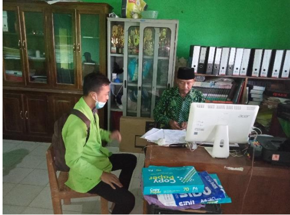
Dokumentasi Wawancara dengan Kepala sekolah