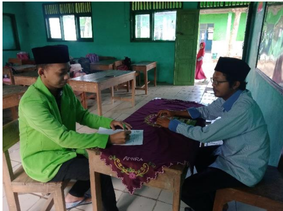
Dokumentasi Wawancara dengan Guru Bahasa Arab