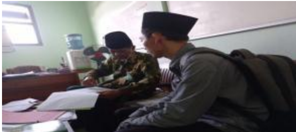
FOTO-FOTO PROSES PENELITIAN