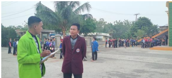
المقابلة مع قسم اللغة