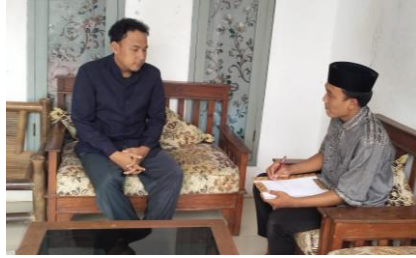
المقابلة مع مشرف اللغة