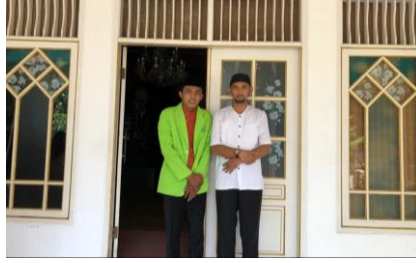
المقابلة مع مدير معهد دار الرحمة بوجور