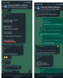
Gambar 3.4 Tampilan Bukti Peraturan Potongan 5% Untuk Anggota Yang Mendapatkan Arisan Online pada grup Whatsapp Ghibah Arisol Mama Muda 23