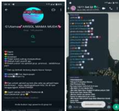
Gambar 3.1 Tampilan akun Whatsapp Grup Ghibah Arisan Mama Muda