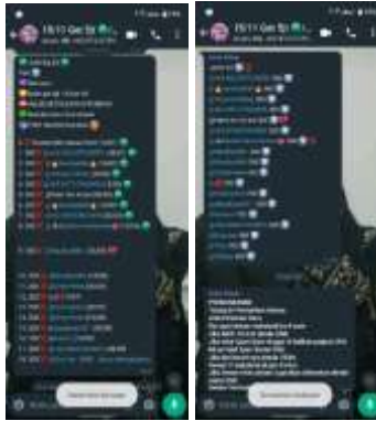
Gambar 3.3 Tampilan slot Arisan Online Get 5 juta pada grup Whatsapp Ghibah Arisol Mama Muda