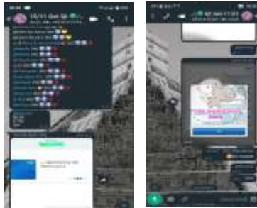
Gambar 3.6 Bukti Pencairan Owner via Transfer Pada Anggota Arisan 24

Namun pada prakteknya pencairan pada bulan oktober setelah ditetapkannya peraturan baru, setiap anggota hanya mendapatkan haknya sebesar Rp.4.750.000 hal tersebut disebabkan karena owner pada tanggal 10 Oktober menetapkan peraturan setiap pencairan di potong 5%. Sehingga anggota pada nomor 18-21 hanya mendapatkan haknya sebesar Rp. 4.750.000. sedangkan untuk peserta nomor 1-17 utuh mendapatkan haknya sebesar Rp.5.000.000