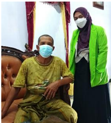
(wawancara bersama jemaah umrah)