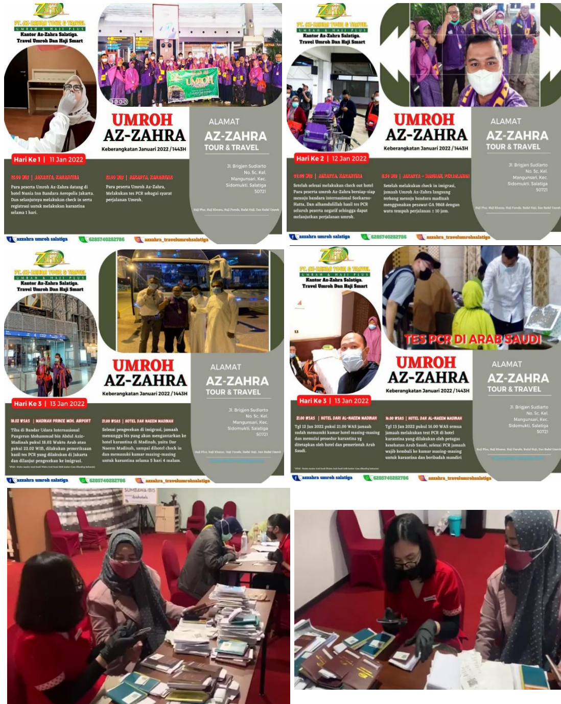
(Jemaah tiba di Jakarta, dan langsung melakukan tes PCR setelah itu check in hotel)