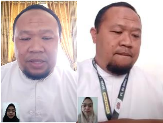
(wawancara bersama Direktur PT. Az-Zahra)