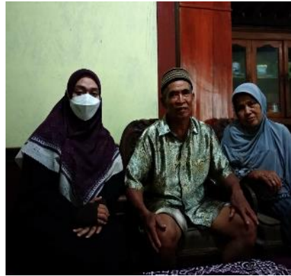
(wawancara bersama jemaah umrah)