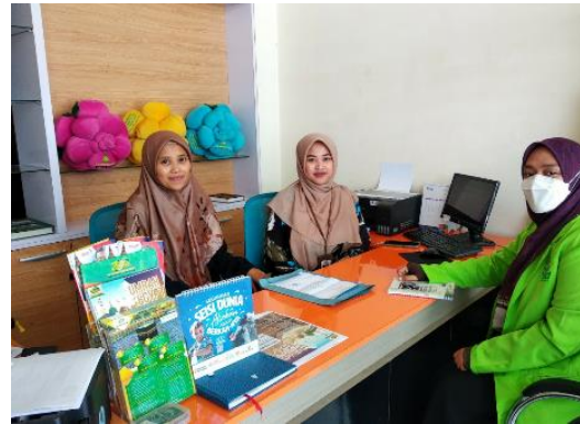
(wawancara bersama Staff PT. Az-Zahra)