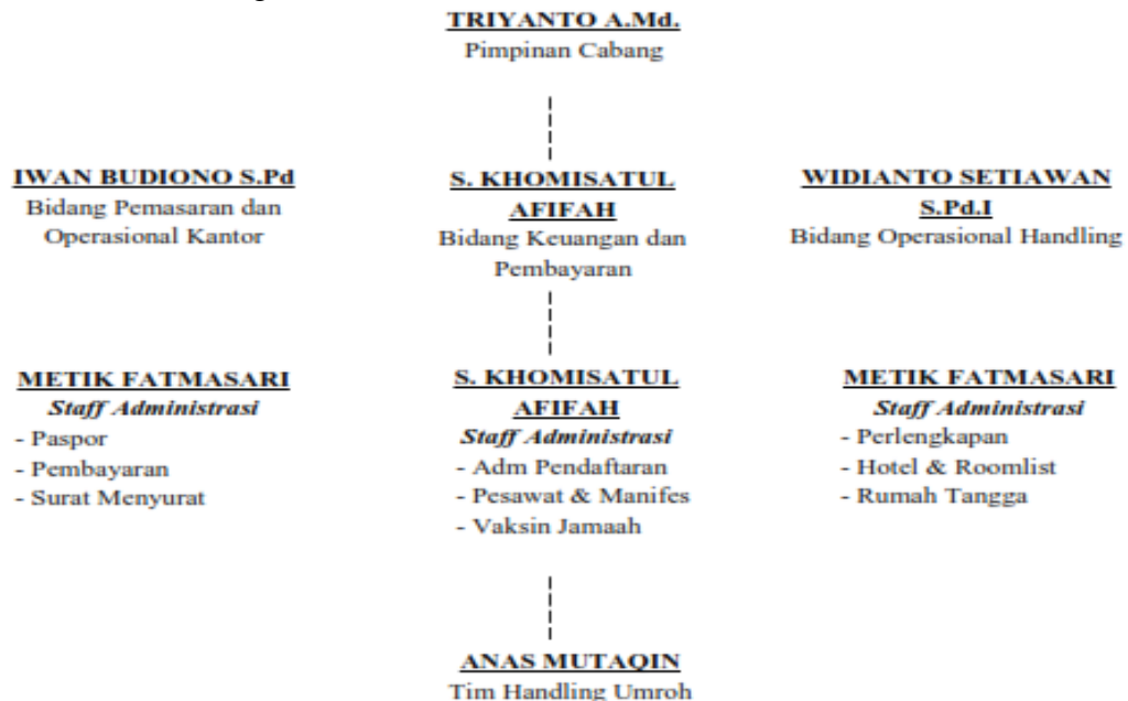
Gambar 1. Bagan Struktur Organisasi PT Az-Zahra Tour & Travel Salatiga

Berdasarkan hasil wawancara bersama salah satu staff PT. Az-Zahra Salatiga (Mba Metik) diperoleh data struktur organisasi PT Az-Zahra Salatiga dalam bagan berikut: