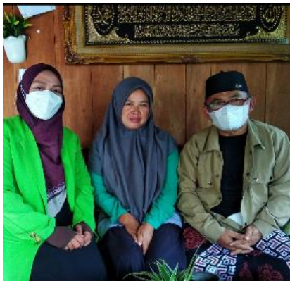
(wawancara bersama jemaah umrah)