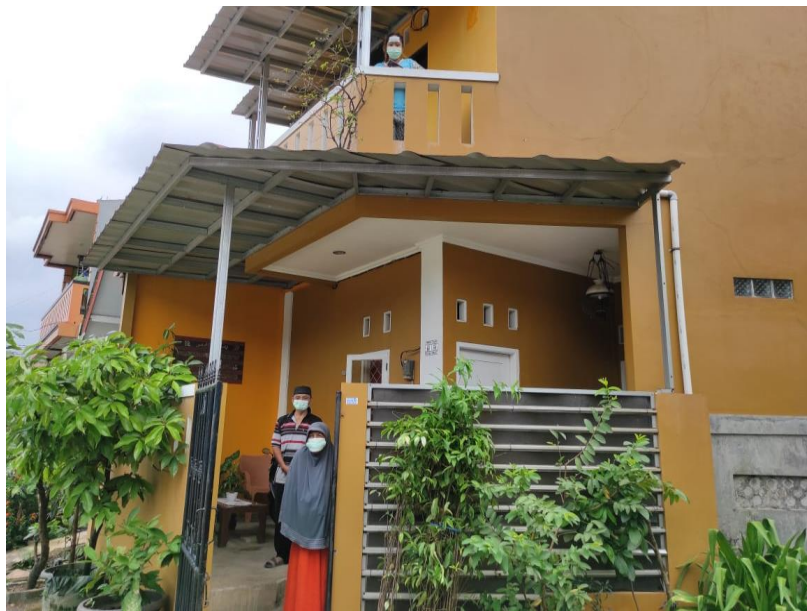
Gambar 8 Masyarakat Melakukan Isolasi Mandiri

Adanya persepsi berbeda dan akhirnya membangun keyakinan tentang Covid-19 sehingga mengakibatkan informan bersikap lain terhadap kebijakan social distancing. Relasi sosial menjadi alasan yang kuat bagi mereka untuk tetap bercengkrama meskipun jarak sosial diabaikan.