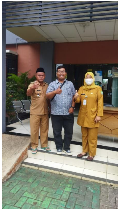
Foto Kegiatan Wawancara