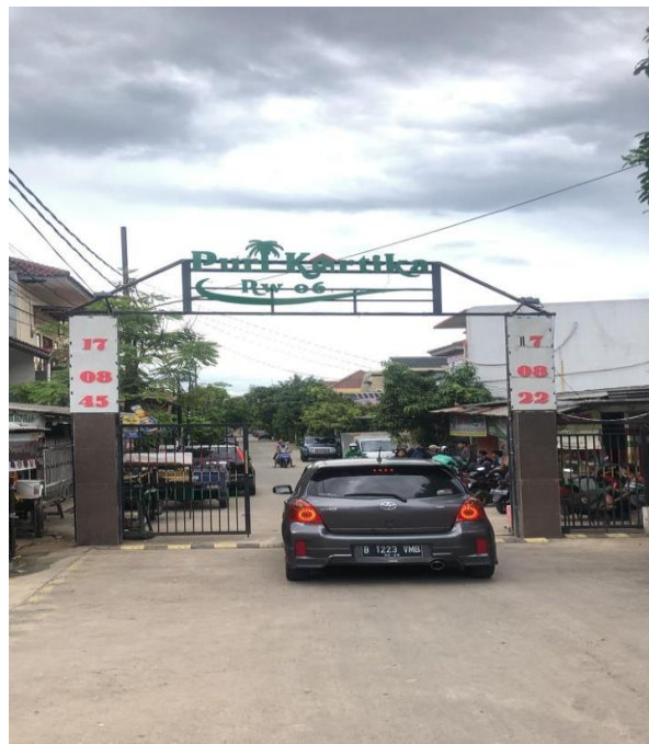
Gambar 2 Komplek Puri Kartika

Letak geografis yang strategis berdekatan dengan Provinsi DKI Jakarta membawa pengaruh terhadap pembangunan di Kelurahan Tajur. Pesatnya pembangunan ibu kota Jakarta sangat membutuhkan lahan untuk para pendatang, khususnya untuk tempat tinggal. Oleh karena itu Kelurahan Tajur menjadi pilihan karena strategis dan cukup dekat untuk ke daerah Jakarta. Pembangunan yang terjadi memanfaatkan lahan pemilik seorang penduduk setempat yang sebelum menjadi perumahan lahan tersebut dikelola masyarakat setempat untuk berkebun yang merupakan warga asli betawi yang mendiami wilayah Kelurahan Tajur. Kelurahan Tajur Saat ini memiliki 56 RT dan 10 RW yang meliputi Kampung Keramat Rompang, Kampung Tajur, Kampung Ciputat dan beberapa kompleks perumahan yaitu Komplek Wisma Tajur, Aden Residence, Komplek Puri Kartika.