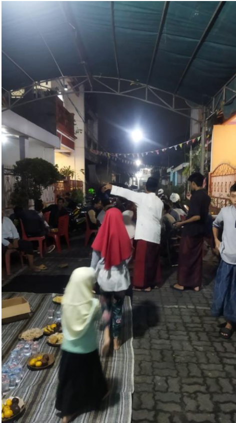
Gambar 5 Kegiatan Keagamaan Tetap Berjalan Salah Satu Bentuk Perlawanan Terbuka