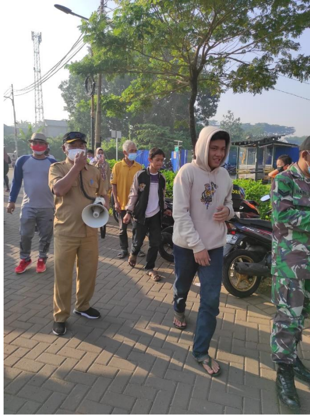
Gambar 7 Masyarakat Berkegiatan Diluar Tanpa Menggunakan Masker