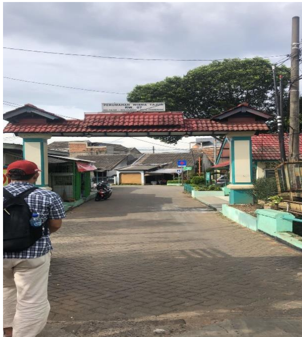
Gambar 4 Komplek Wisma Tajur