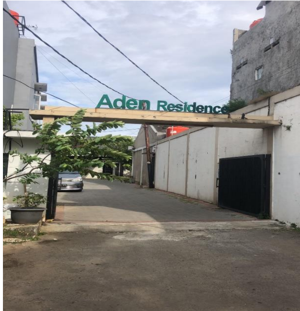
Gambar 3 Komplek Aden Residence.