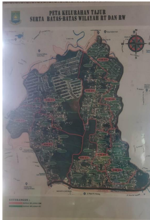
Gambar 1 Peta Kelurahan Tajur, Ciledug, Kota Tangerang

Berdasarkan sejarah Kelurahan Tajur, Ciledug, Kota Tangerang pada awalnya hanya terdiri dari 3 perkampungan wilayah penduduk yang dihuni masyarakat betawi, namun yang menempati wilayah tajur disebut dengan istilah "Betawi pinggiran" yang mata pencahariannya adalah seorang petani. Masyarakat pada saat itu meyakini bahwa nenek moyang leluhur mereka adalah Sultan Hasanudin yang berasal dari Banten. Mereka melakukan bentuk penghormatan kepada leluhurnya dengan cara mengadakan pengajian 7 hari setelah lebaran atau idul fitri yang diadakan oleh masyarakat Tajur pada saat itu.