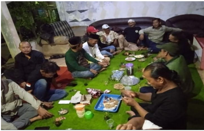
Gambar 6 Kegiatan Arisan Warga Salah Satu Perlawanan Terbuka

Sebelum masa pandemi Covid-19 kegiatan arisan ini merupakan kegiatan yang sering dilakukan warga Kelurahan Tajur khususnya warga RT 03 yang dimana acara arisan warga ini dilakukan dalam sebulan sekali dan diselingi acara diskusi masyarakat. Awalnya kegiatan arisan ini sebagai wadah untuk menampung aspirasi warga, namun ketika pandemi Covid-19 melanda kegiatan arisan yang dilakukan pada masa pandemi ini berguna untuk ketua RT khususnya ketua RT 03 Kelurahan Tajur untuk mengetahui dan mengontrol kondisi warganya selama pandemi Covid-19.