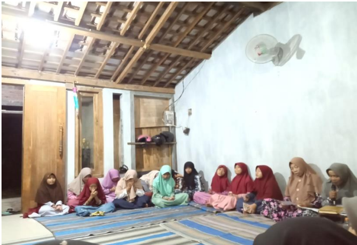
(Dokumentasi anak mengikuti kegiatan keagamaan yasinan di masyarakat)