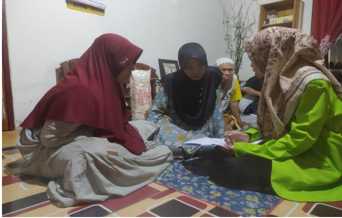
(Dokumentasi kegiatan wawancara dengan Ibu KY)