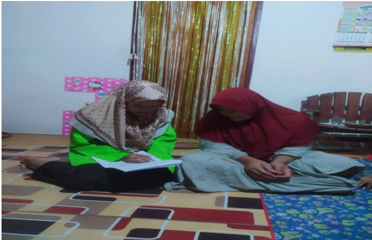
(Dokumentasi kegiatan wawancara dengan Adek AK)