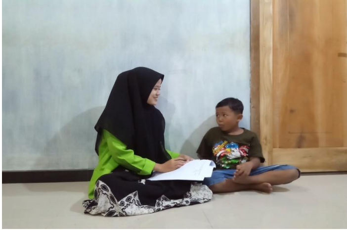
(Dokumentasi kegiatan wawancara dengan Adek AZ)