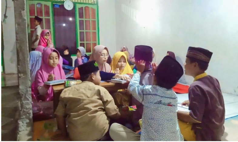
(Kegiatan anak-anak mengaji di TPQ)