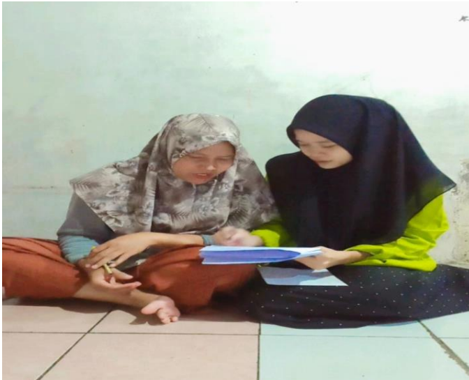
(Dokumentasi kegiatan wawancara dengan ustadzah MJ)