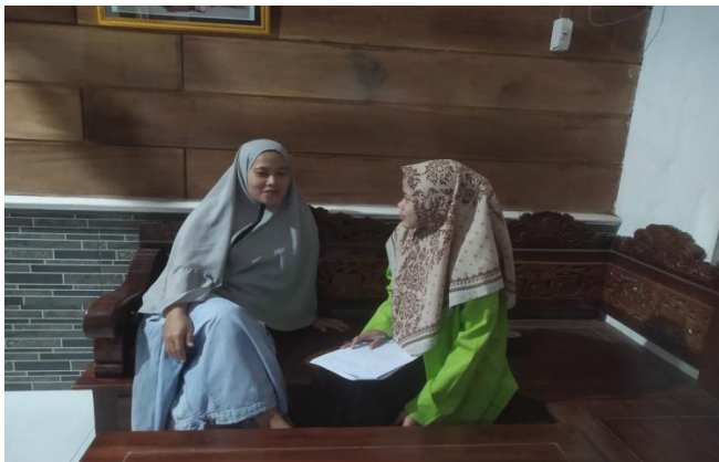
(Dokumentasi kegiatan wawancara dengan Ibu LM)