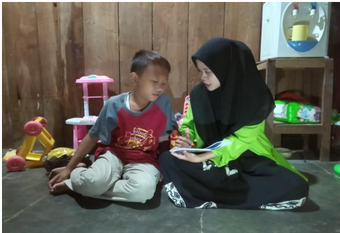
(Dokumentasi kegiatan wawancara dengan Adek AH)