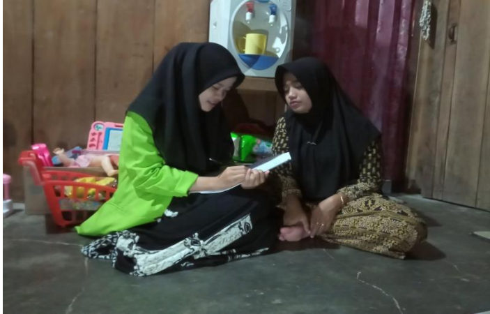
(Dokumentasi kegiatan wawancara dengan Ibu RY)