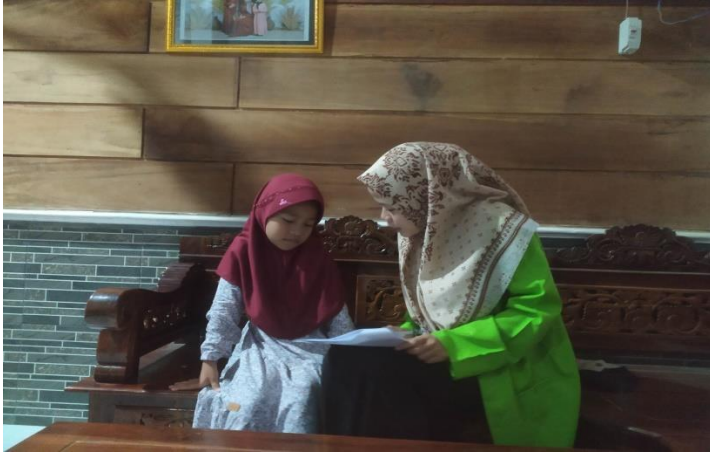
(Dokumentasi kegiatan wawancara dengan Adek RA)