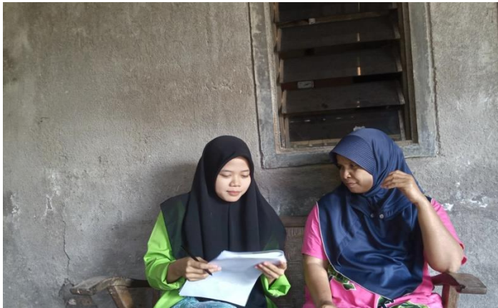
(Dokumentasi kegiatan wawancara dengan Ibu AD)