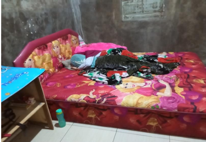
(Dokumentasi anak sudah tidur di kamar sendiri)