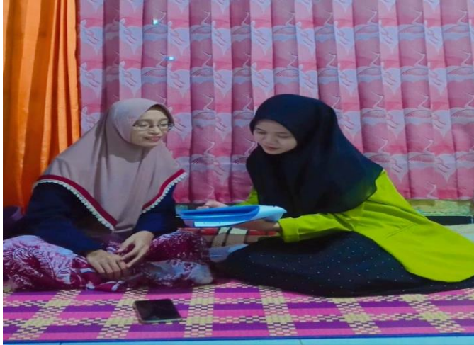
(Dokumentasi kegiatan wawancara dengan ustadzah NH)