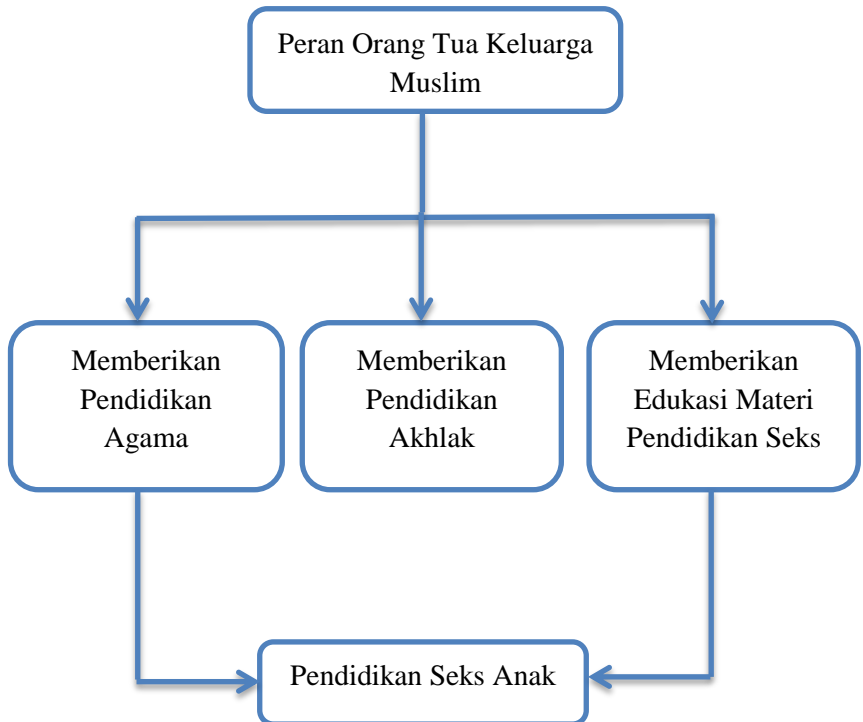
Gambar 2.1 Skema Kerangka Berpikir

Pendidikan seks menjadi suatu hal yang tidak tabu lagi, karena mereka telah mengetahui apa itu seksualitas dan bagaimana mengantisipasi gejolak yang ada dalam dirinya yang telah mereka dapatkan dari orang tua. Melalui pendidikan seks yang benar, anak-anak diharapkan dapat melindungi diri mereka dan terhindar dari kejahatan pelecehan seksual, serta dapat bertanggung jawab dalam mengendalikan hasrat seksualnya.