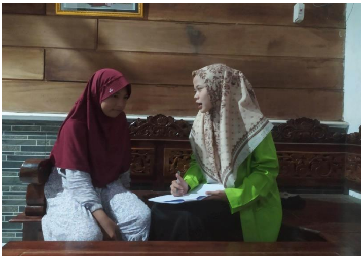
(Dokumentasi kegiatan wawancara dengan Adek SC)