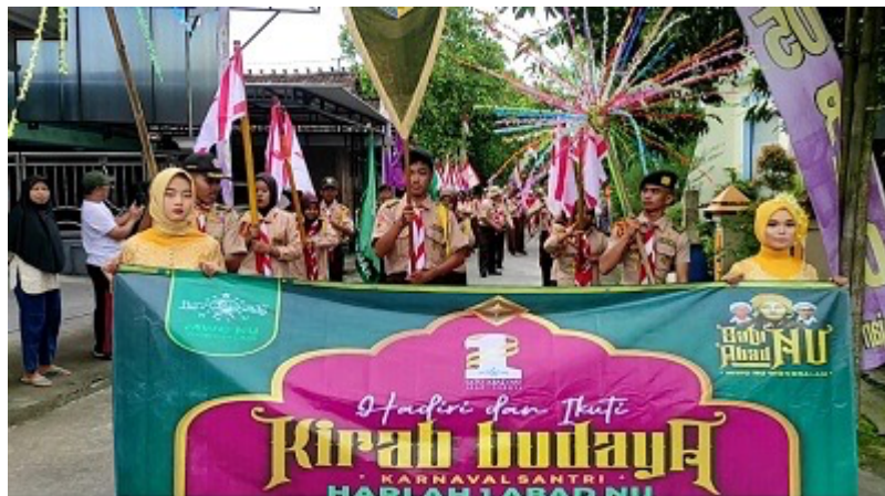
Gambar 2 Kirab Budaya Desa Mranak

Masyarakat Desa Mranak masih memegang adat kebiasaan yang ada sejak dulu hingga dan saat ini masih dilestarikan. Kondisi keagamaan masyarakat di Desa Mranak secara umum dapat dikatakan bahwa mayoritas penduduknya adalah beragama Islam. Kegiatan yasinan, tahlilan, ziarah makam, pengajian umum, tausiah keislaman, kirab budaya mengenai keagamaan, dan lain-lain secara rutin selalu dilaksanakan. Berikut ini kirab budaya keagamaan di Desa Mranak.