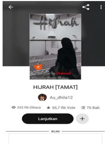
Gambar 3. Cover Wattpad “Hijrah”