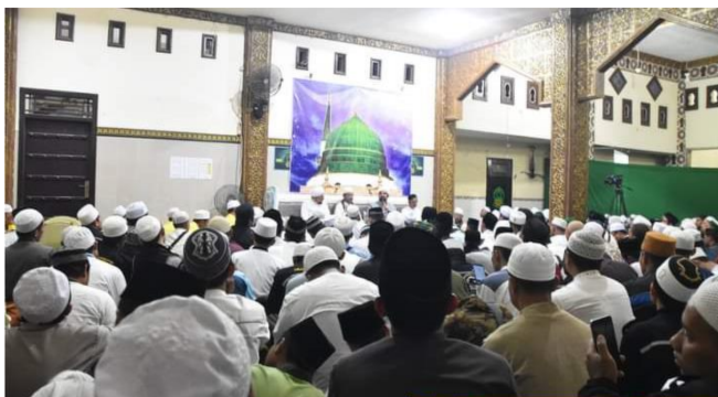
Rutinitas Malam Selasa Majelis Rasulullah SAW