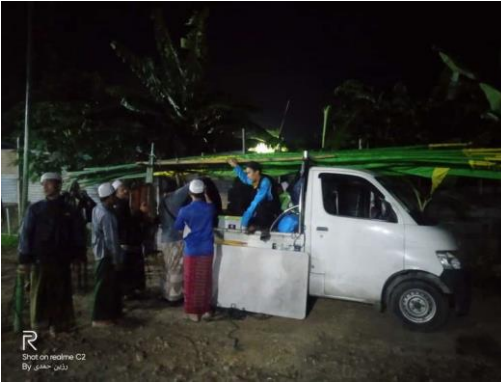
Semua Pengurus dan Simpatisan Ikut Andil Sebelum Acara