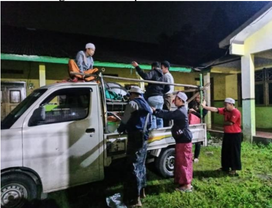
Semua Pengurus dan Simpatisan Ikut Andil Sebelum Acara