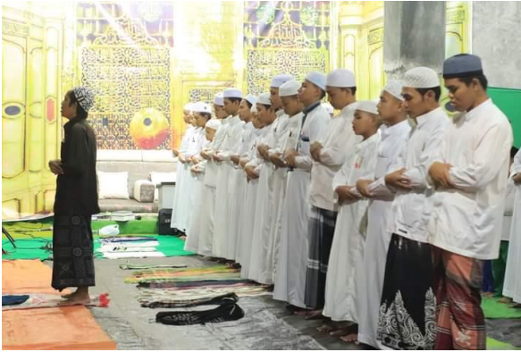
Sholat Jamaah Majelis Rasulullah SAW sesudah Acara Rutinan Bulanan yang Bertepatan Waktu Sholat