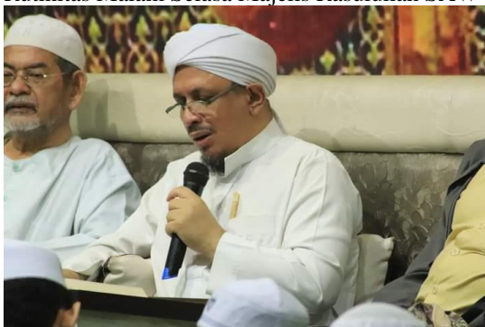
Pembacaan Maulid Ad-dhyaulami.