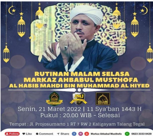
Brosur Pengumuman Pengajian Majelis Rasulullah SAW