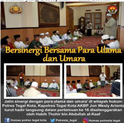
Forum Ulama dan Umara (Pemerintah)