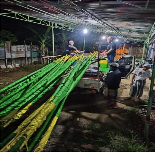
Divisi Umbul-Umbul Majelis Rasulullah SAW