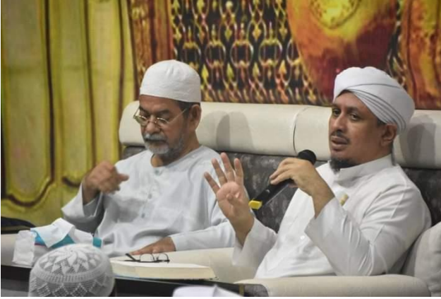
Kajian Kitab Manhajus Sawi Rutinan Malam Selasa