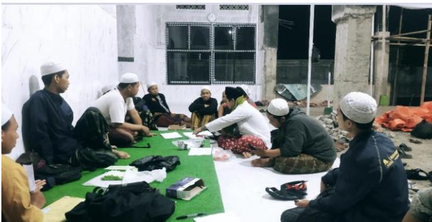
Rapat Semua Divisi Sebelum Kegiatan Majelis Rasulullah SAW