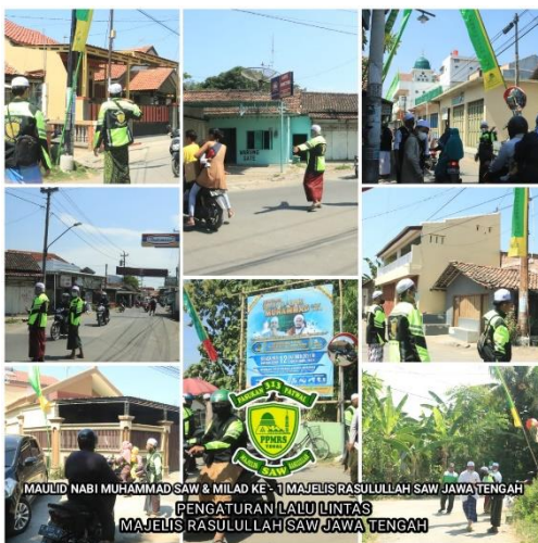
Divisi PPMRS Saat Mengatur Lalu Lintas