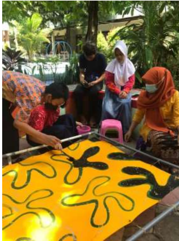
Tabel 3. 2 Kegiatan Bimbingan Kelompok (Interaksi Sosial Asosiatif)

YPAC Semarang sendiri terdapat berbagai kegiatan yang dicanangkan berupa kegiatan ekstrakurikuler, seperti musik, angklung, tari, membatik, dan lain sebagainya. Dengan adanya kegiatan ekstrakurikuler tersebut, anak-anak penyandang tunagahitra mengaku senang dikarenakan mereka dapat lebih mengeksplor diri serta dapat berinteraksi dengan teman-temannya yang lain.