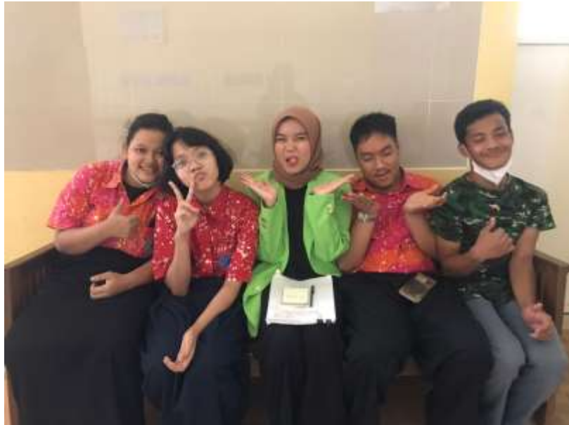
4) Kegiatan Bimbingan Kelompok Interaksi Sosial Asosiatif