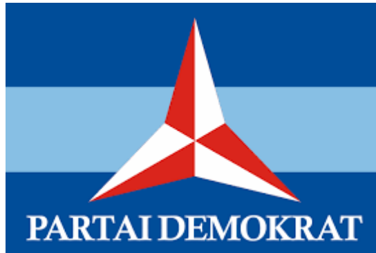
Gambar 2 Lambang Partai Demokrat