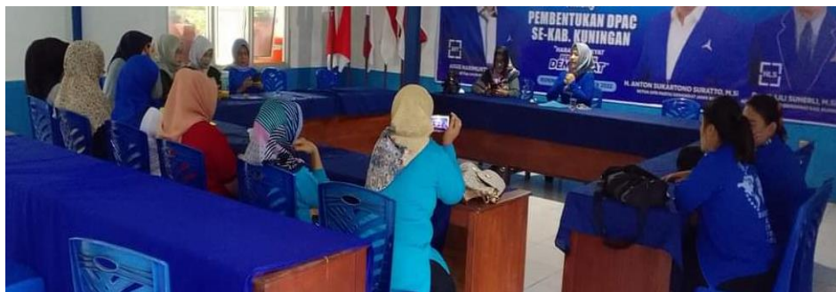
Gambar 5 Srikandi Demokrat Memberikan Sosialisasi Kepada Masyarakat di Kantor Sekretariat DPC Partai Demokrat