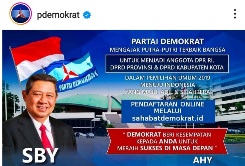
Gambar 6 Akun Instagram Dewan Pimpinan Pusat Partai Demokrat

Pendaftaran rekrutmen melalui laman website sahabatdemokrat.id . Pendaftaran rekrutmen calon legislatif yang dilakukan oleh Dewan Pimpinan Cabang (DPC) Partai Demokrat dibuka selama 6 bulan dan daftar diserahkan ke KPU.