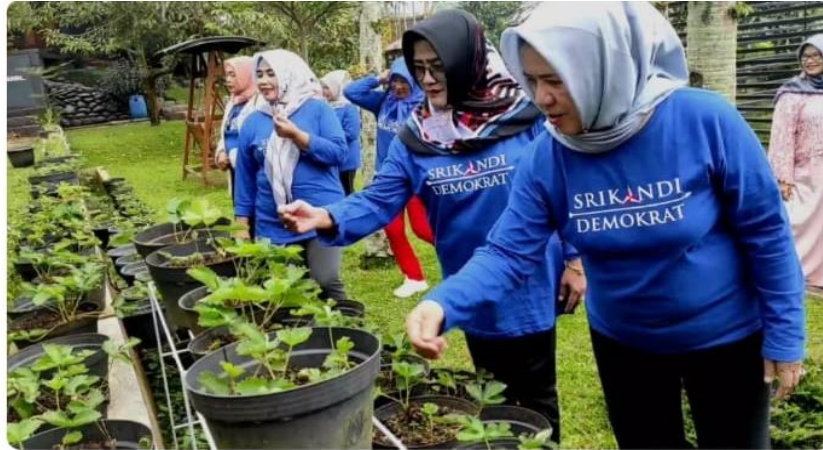
Gambar 4 Srikandi Memanen Hasil Berkebun

telah dilaksanakan oleh Srikandi demokrat ialah senam massal yang diadakan setiap hari Jum'at pukul 08.00 WIB di halaman sekretariat DPC Partai Demokrat.